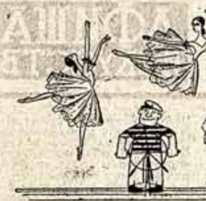
Кадр из фильма «Валерия на корабле»...