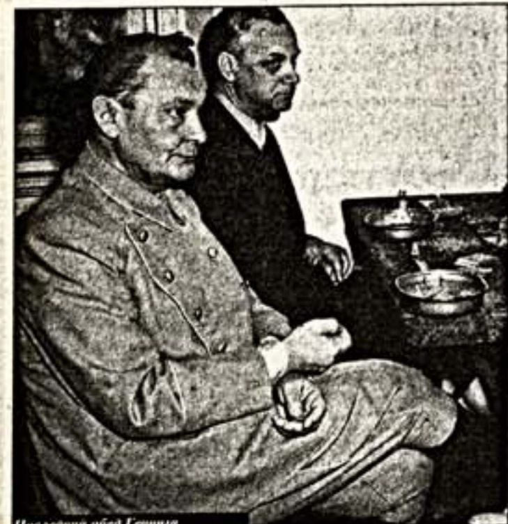
После пленения Гитлера

Среди целой армии корреспондентов, освещавших ход суда, был фотограф Евгений Халдей. Его снимки из победного 45-го "Культура" в этом юбилейном году уже не раз публиковала. Пришла пора нашему старому другу и сотруднику дойти до завешенной папки фотографии, на которых крупным планом запечатлены уже не победители, которых он снимал все четыре года войны, в побежденные. Да не простые, а именитые преступники "первого ряда"... Тогда на весь мир прозвучало: "Встать! Суд идет!"