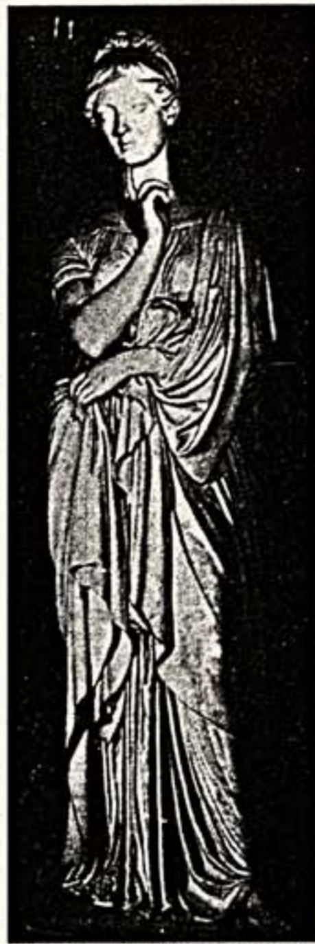
Здесь около 1830 года и позировала прославленному Торвальдсену, президенту самой престижной Академии искусств в Европе...