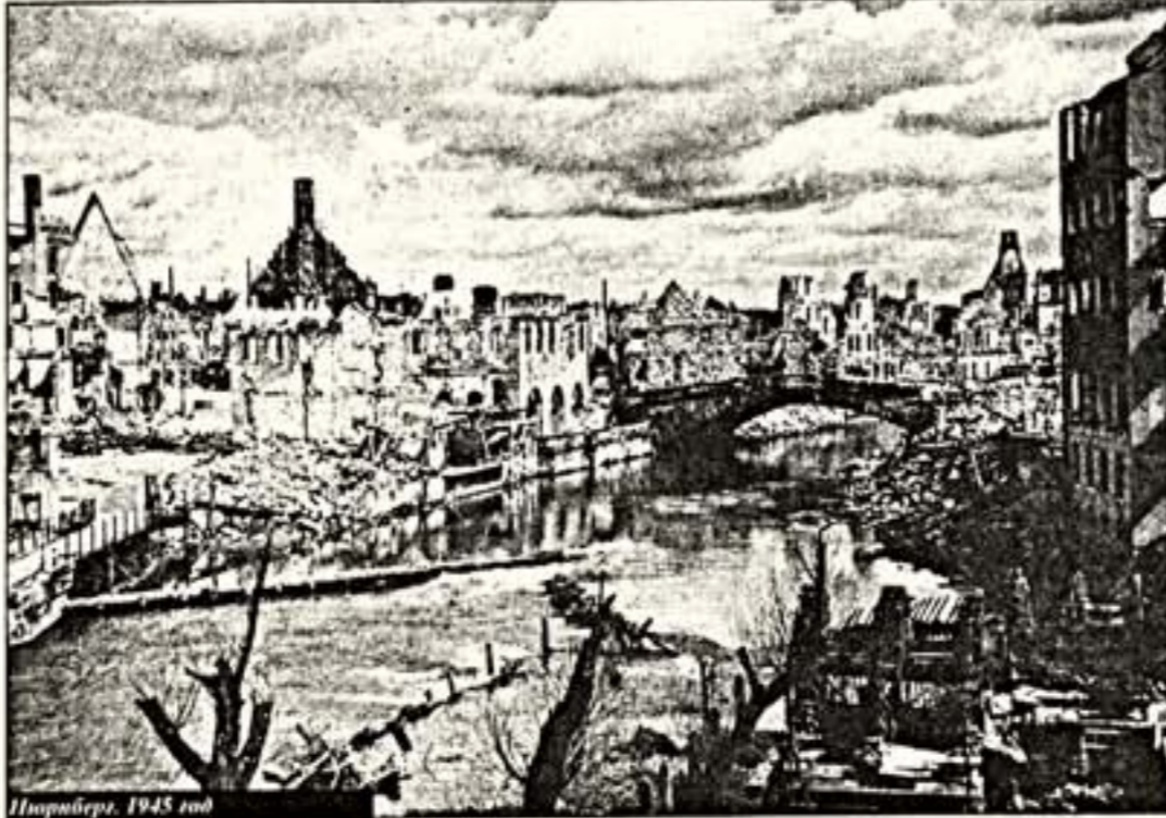
Нюрнберг, 1945 год

Пока живы эти свидетели, пока будет жить последний фронтоник, суд над теми, кого окрестили заклятыми врагами человечества, будет продолжаться. Но оправдания им и на том свете не дожидаться до веки веков!