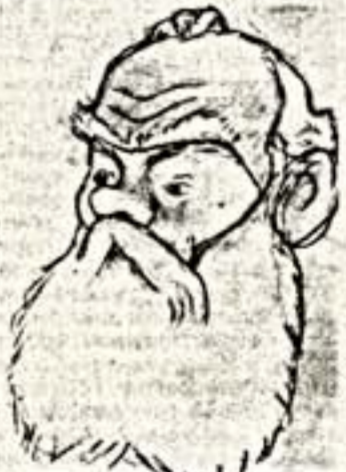
Шуточка с порывом века

предложил нарисовать шаржи с железяками. Это вызвало шумное оживление: — Меня!.. Нет, меня! Вон того!