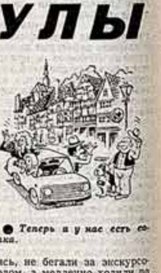
● Теперь и у нас есть...