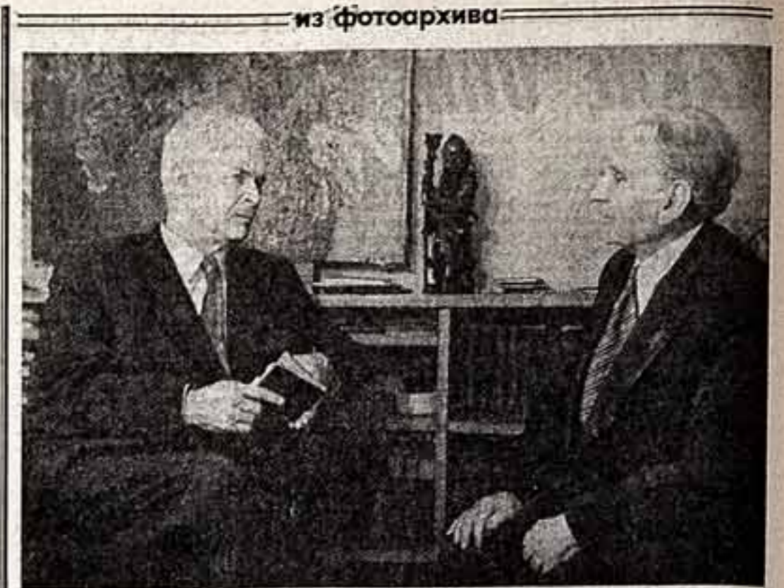
Б. ВИДЕКИН. Выдающийся мастер советского искусства Александр Достоевский и Маргарос Сарьян. (1955 год).

Вспомните, что в последние десятилетия охватили многие специальности: существуют институты усовершенствования врачей, институты повышения квалификации учителей, Высшие инженерные курсы при Госгосте СССР и многие другие аналогичные учреждения. Но есть, однако, сферы, где налаженные системы постоянного образования производят не так активно и целеустремленно. У меня лично очень серьезную тревогу вызывает оставление в деле переподготовки педагогов детских музыкальных школ.