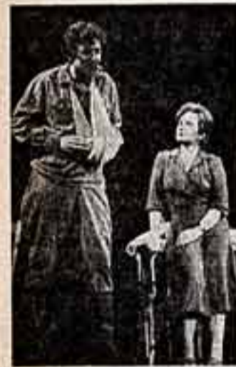
Московский драматический театр на Малой Бронной показал новый спектакль — «Юппус» по роману В. Кондратьева.