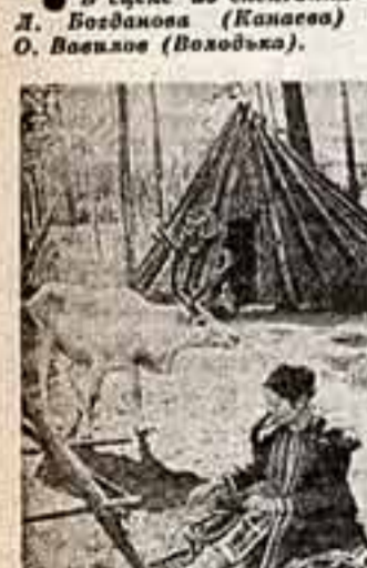
Сберечь для потомков черты народного бытия, народную архитектуру и прикладное искусство — такова задача Этнографического музея.