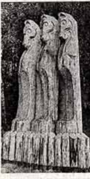
кустом и тем самым превратил его в обитель добрых волшебников, в добрую старую сказку, подарить нам — каждому из нас — воспоминание о детстве.