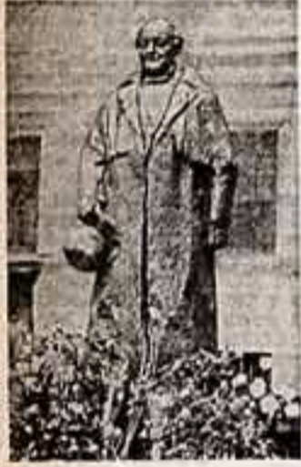
Памятник великому русскому автору Михаилу Семеновичу Щепкину установлен в Москве у здания Театрального училища.