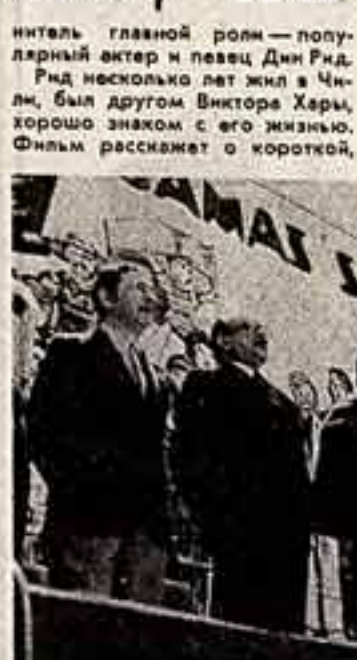
Кадр из фильма «Песня».

...Вслед за автоматной очередью раздается треск пулемета. Слышится детский крик. За колонией проволочной колючей сетки огромные людские моря. Безудержные «горючие» деревья под прицелом стариков, женщины, детей. То и дело кто-то из оравников нажимает на курок, звучат выстрелы. Старею погнался мной, оставил кровавый след в истории. Кто-то на заключенных запевает песню, эту песню подхватывают сначала его товарищи, а потом и вся планета. «Вансеромос Вансеромос!» Песня нарастает, валит над головами, заглушает выстрелы и взрывы.