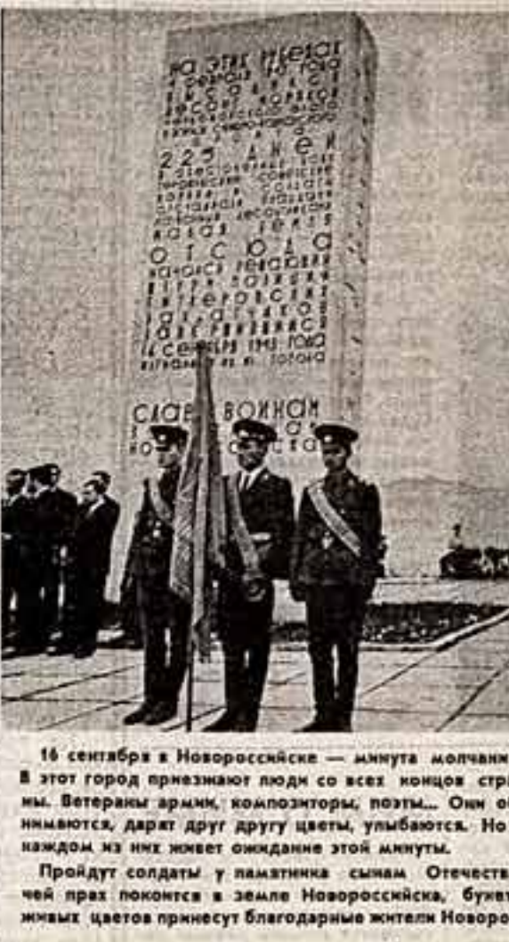
16 сентября в Новоросийске — минута молчания. В этот город признают люди со всех концов страны. Ветераны армии, композиторы, поэты...