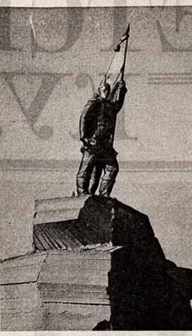
В городе Андижре — центр Чукотского национального округа — угаживает мальчишки премью Рекую Чукотки. Автор — скульптор М. Ракитин. Фото С. Белого (ТАСС).