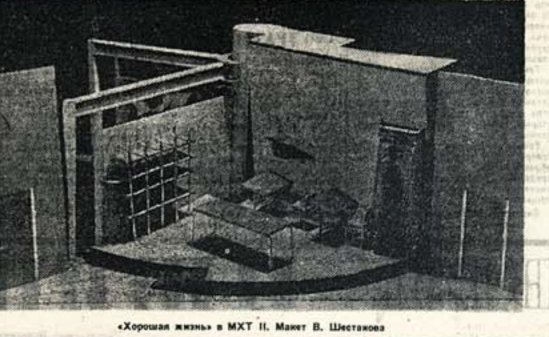
«Хорошая жизнь» в МХТ П. Мавит В. Шестакова