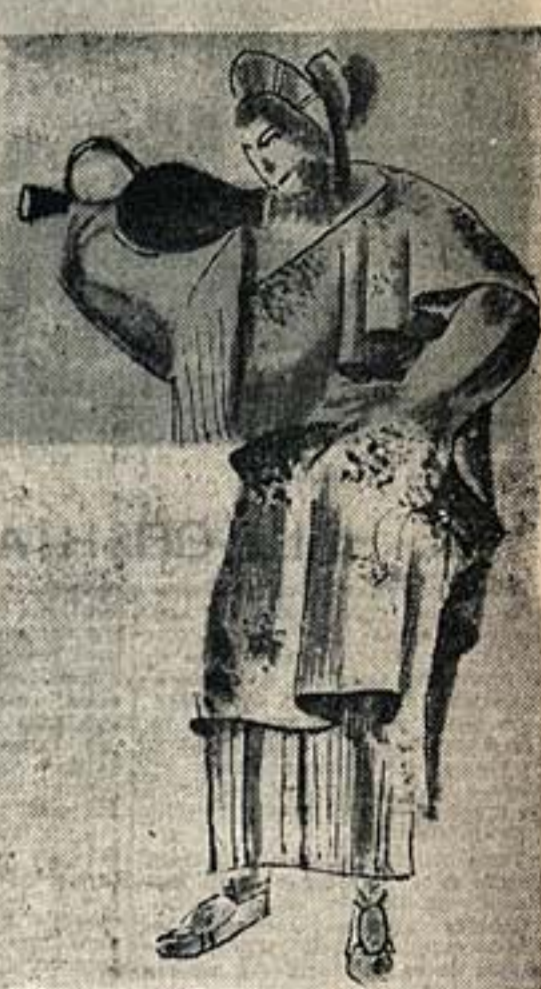
«Лизинграты». И. Рабинович. Эскиз костюма