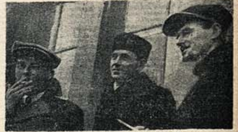
Братья Васильевы и артист Бабочкин в Москве

В Доме печати состоялся встреча журналистов Москвы с авторами фильма «Чапаев» — режиссерами бр. Васильевыми и артистом Бабочкиным.