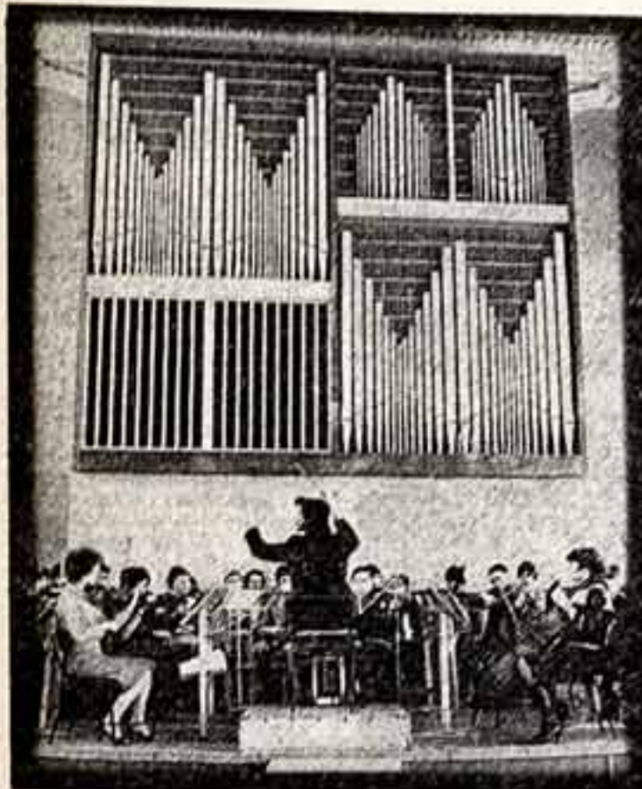
Большой вклад в подготовку высококвалифицированных пианистов, руководителей народных хоров, дирижеров, певцов, музыкантов, руководителей оркестров народных инструментов не только для своей области, но и для Дагестанской, Кабардино-Балкарской, Калининской, Северо-Осетинской и Чечено-Ингушской автономных республик вносит Астраханская государственная консерватория.