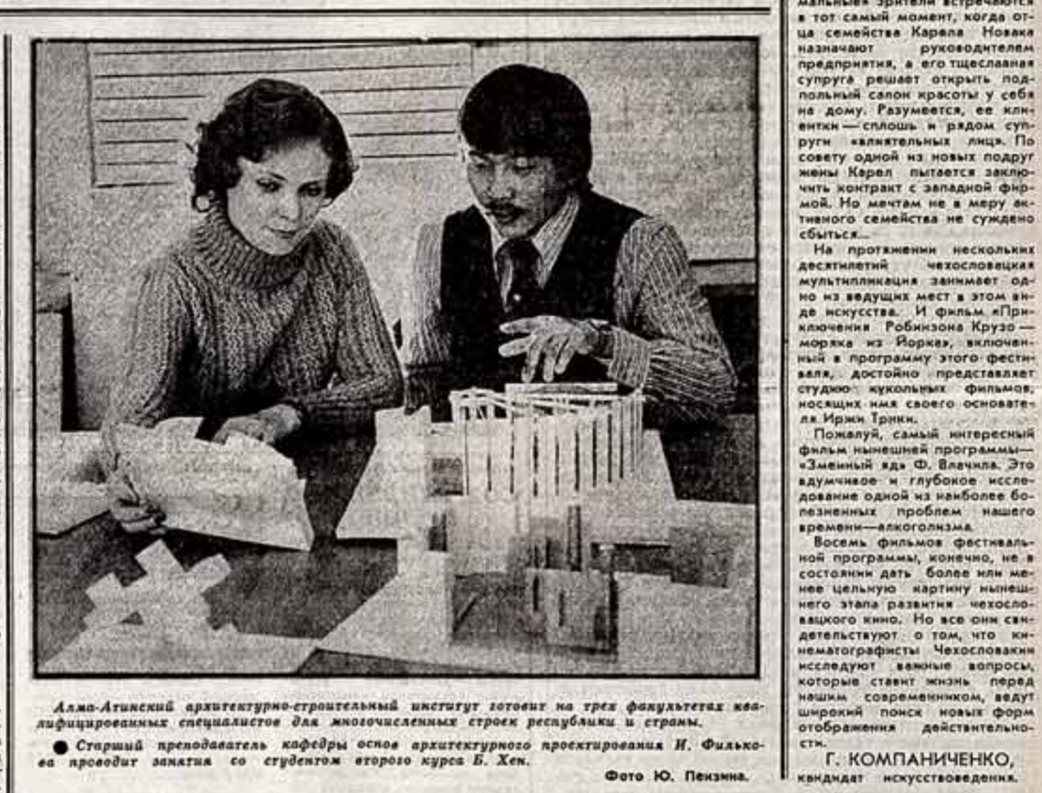
Алто-Атский архитектурно-строительный институт готовит на трех факультетах квалифицированных специалистов для жилищного строительства республик и стран.