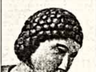
В. Дмитриев. "Георгий".

В особенности огромную композицию, изображающую Георгия и напоминающую ермолинскую скульптуру. Предполагают, что эти рельефы появились здесь во второй половине XV века, через несколько десятилетий после постройки храма. (Кочу, предупредить, что на этот счет существуют и иные мнения). Но предположительно они определенно не для Дмитровского собора.