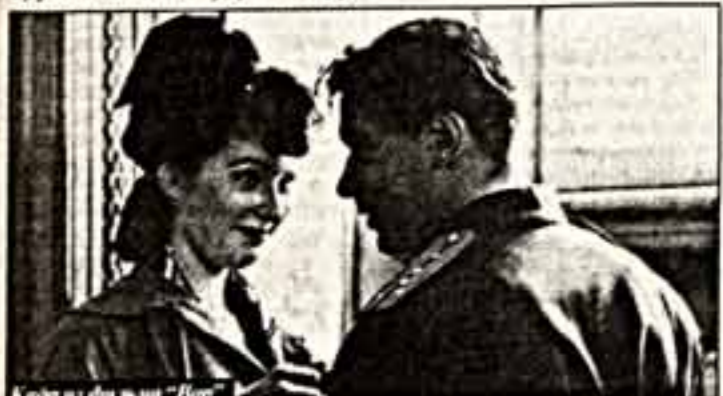
Кадры из фильма "Вор"