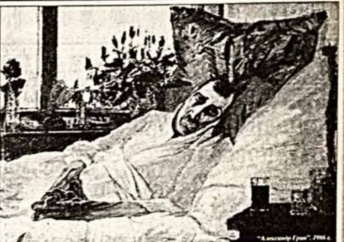
"Александр Грин". 1906 г.