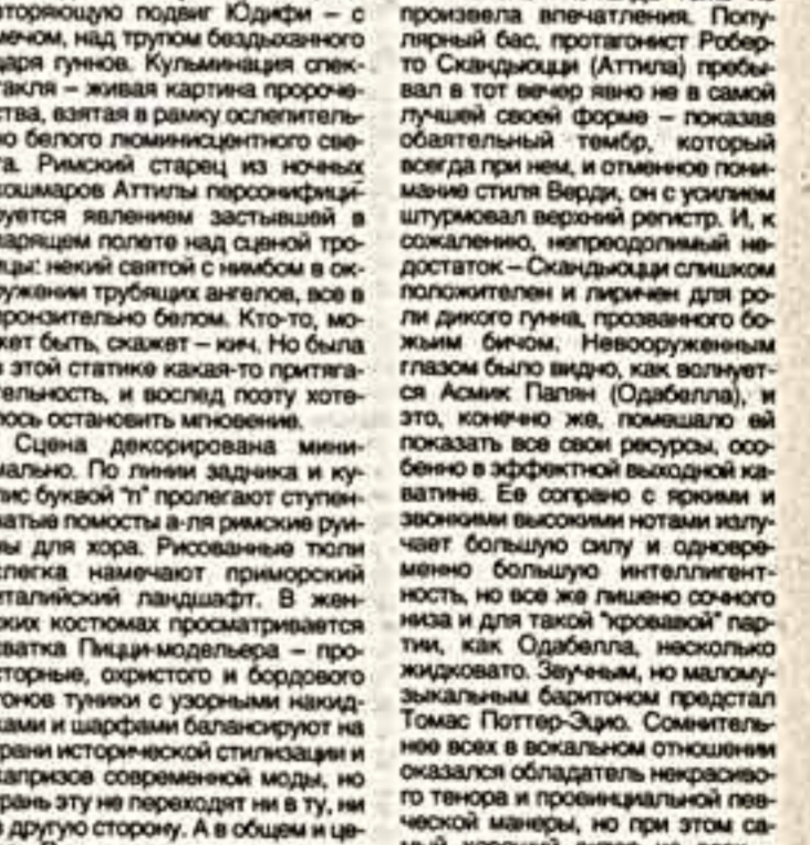
дал в с у Д на ре на к и "Ангел" — актер медлен но по