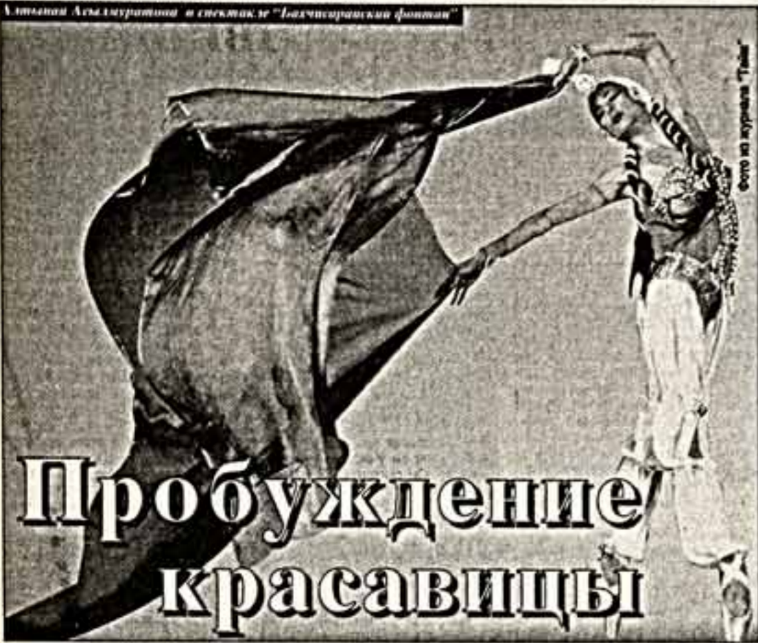
ОНИ О НАС