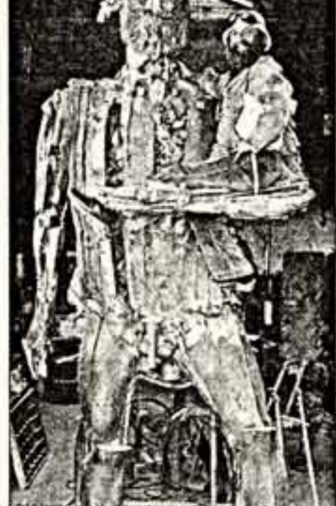
Скульптор за работой