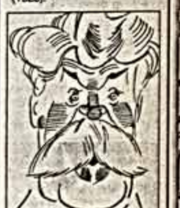
Киргизский кинорежиссер Толмачев СКЕЕВ (1935).

11 сентября - 90 лет со дня рождения писателя и педагога Льва СЕДУХИНА (1907-1974). - Историк и критик балета Вера КРАСОВСКАЯ. - Польская актриса Эва ШИКУЛЬСКАЯ. - Актёр Вольфганг ЛАРИОНОВ (1928).