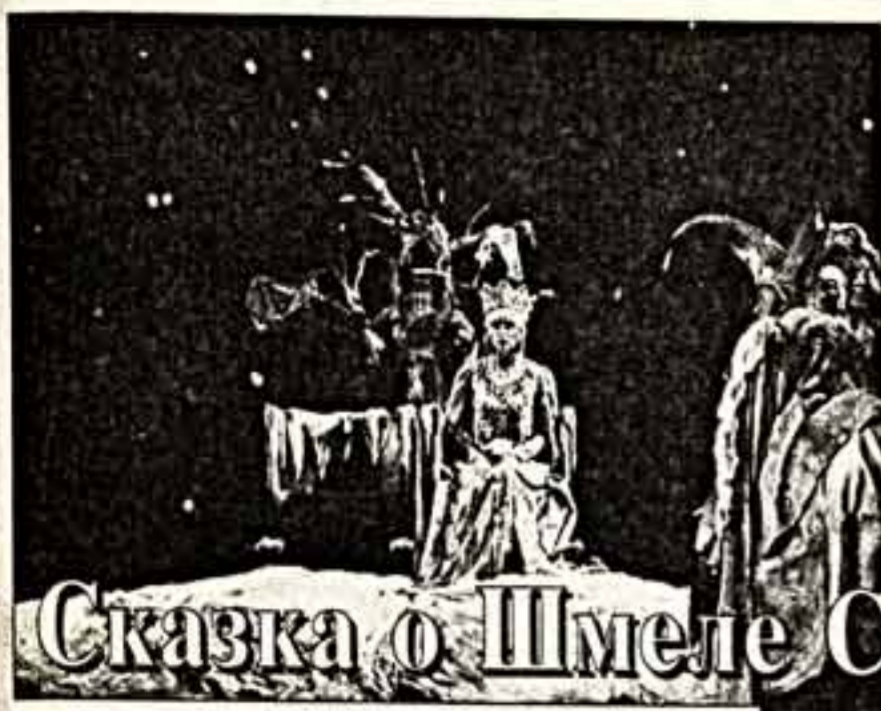
Сказка о Шмеле Салтановиче