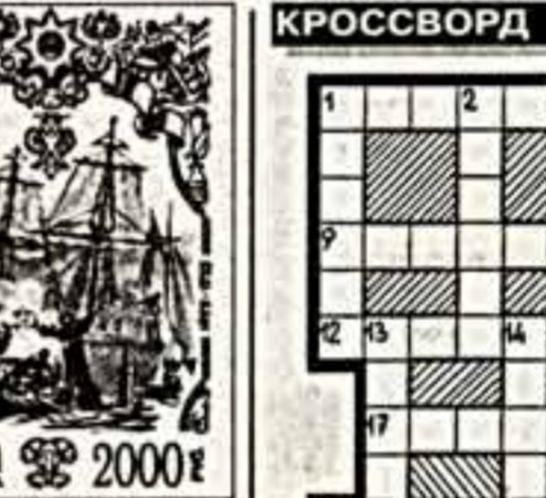
задание регулярной армии и флота.