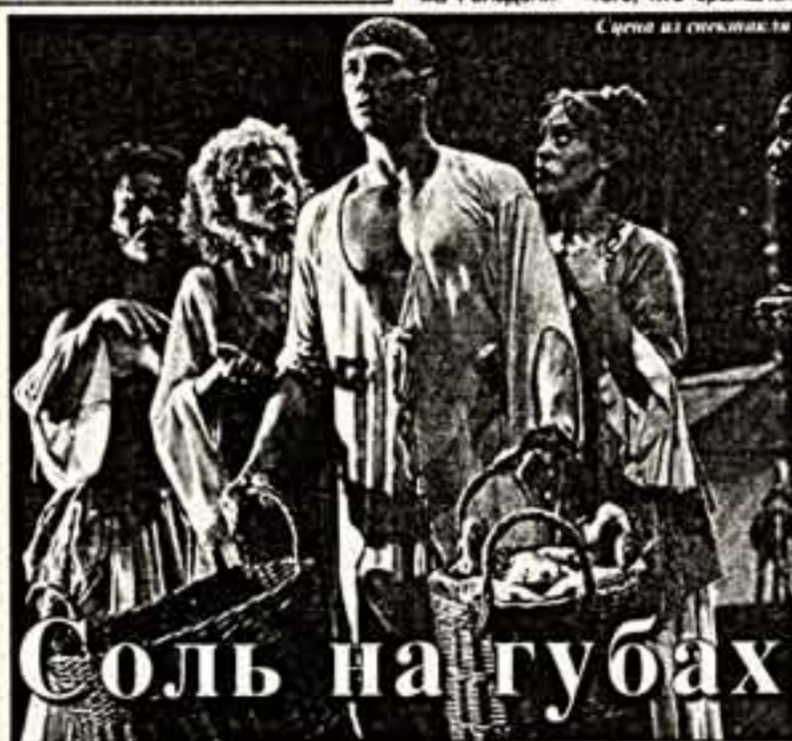
Соль на губах