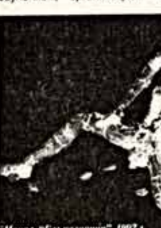
Г. Чахала. "Без названия". 1997 г.