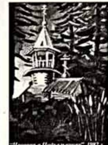
"Притягательную силу" русской природы и выразил художник на своих полотнах. Не случайно по этому краю из первоначальных этапов его работ состоялся в Доме-музее К.Г.Паустовского в Подосковье.