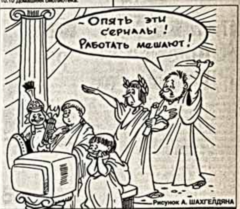
Рисунок А. ШАХТЕДЯНА