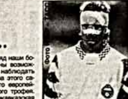
Второй год подряд наши болельщики лишены возможности воочию наблюдать матчи розыгрыша этого самого престижного европейского футбольного трофея.

Начало выхода этого номера сборная Россия по футболу провела свой, пожалуй, самый главный матч в сезоне. И если наши футболисты не проиграли в Соприи команде Болгарии, значит, Россия еще сохраняет шансы на первое место в отборочном турнире чемпионата мира 1998 года. Если же победа за болгарями, значит, нам досталось место в "третьей корзине" и тогда лишь дополнительный круг "вторых мест" решит, достойны ли россияне участия в мировом первенстве. Вообще-то россияне футболисты давно уже не радовали своим поклонников. Сейчас скромной олеушкой оказался провал московского "Спартак" в предарбитражном раунде Лиги чемпионов.