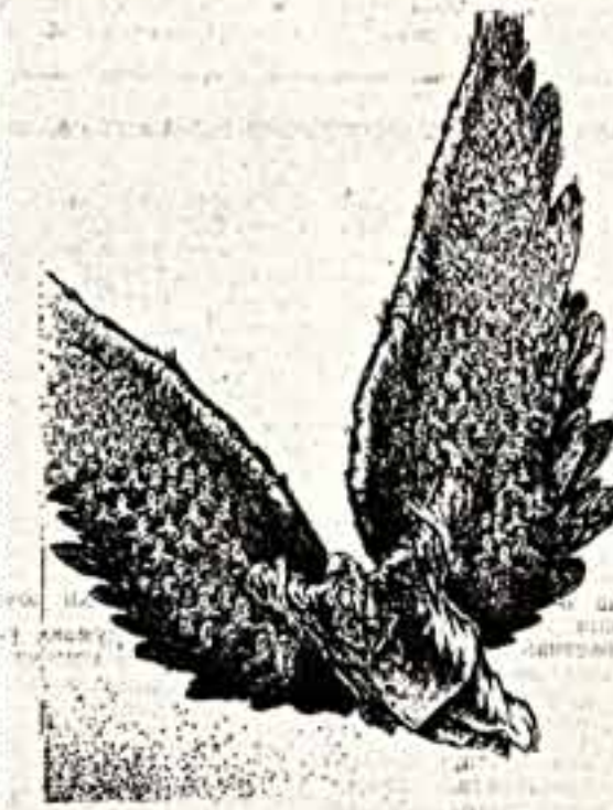
Его надежные крылья.