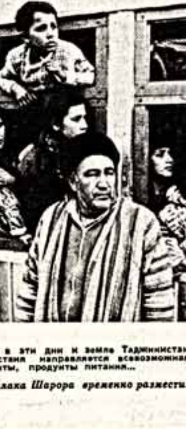
Семья Гейромы из кишлака Шарора временно размещалась в аэровокзальных строениях.

В Братскую республику выехали также узбекские строители для проведения восстановительных работ. В Узбекистане, пострадавшем в 1966 году от разрушительного землетрясения, как свою боль восприняли проживающие в соседней республике. ЦК комсомола Узбекистана в первые же часы после стихийного бедствия отпущены посылки с юртами, одеялами, теплыми вещами. Условием передала 200 тысяч рублей.