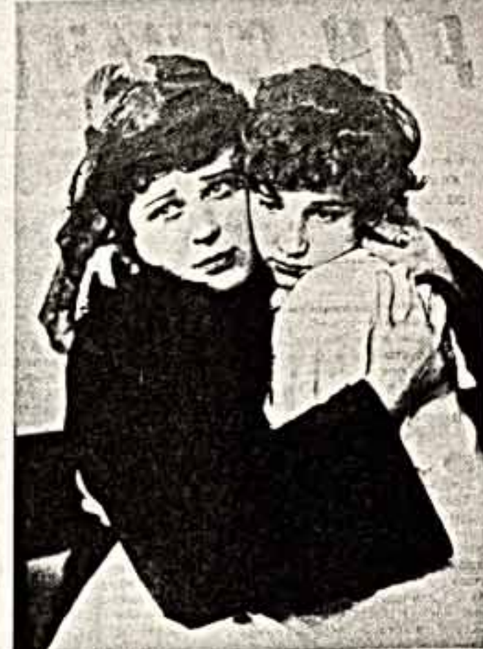
● Народная артистка СССР Алла Тарасова в роли Анны Карениной. 1954 год.