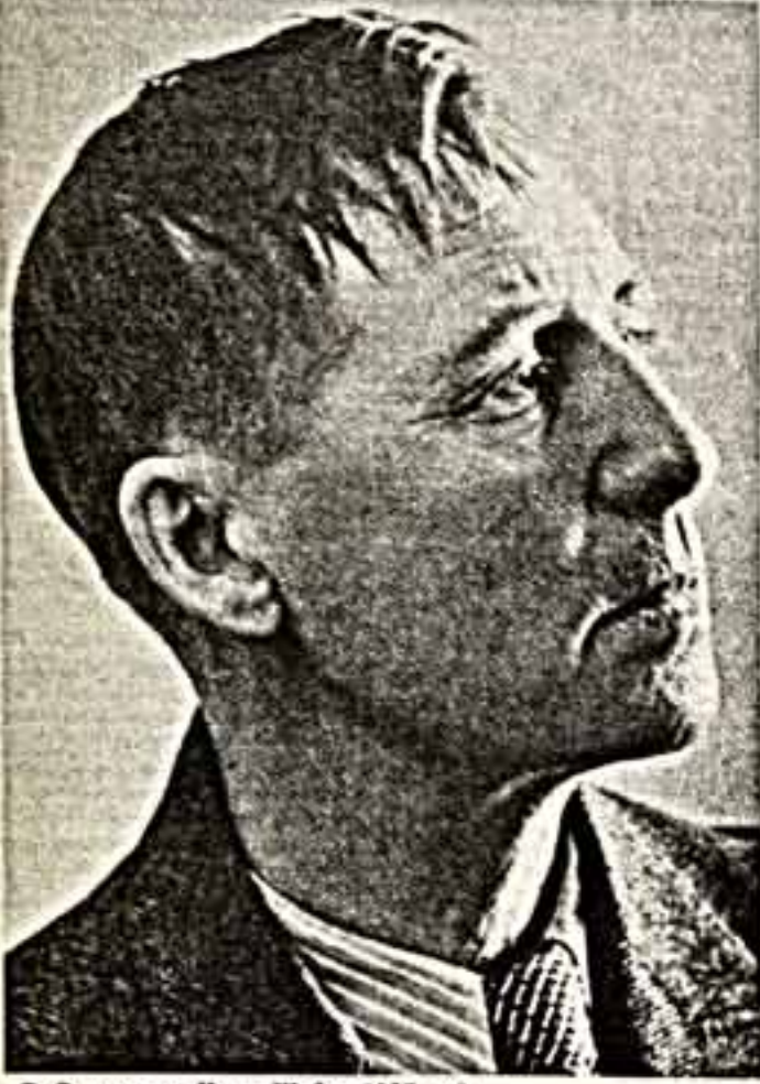
● Скульптор Неке Шадр. 1937 год.

ФОТОГРАФИЧЕСКОЕ искусство, в частности искусство фотопортрета, как, впрочем, и вся сфера художественного творчества, претерпевает в наши беспокойные дни массу метаморфоз и трансформаций. Не на пустом месте возникают они, не плодом умозрительного экспериментаторства являются. За многие десятилетия до наших дней, на рубеже двух российских революций, зародилось и расцвело искусство русского авангарда, оказавшее огромное влияние на жизнь и творческие искания художников повсюду в мире.