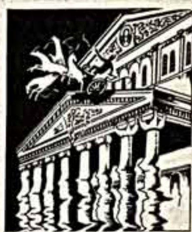
Рисунок А. Яцвинича.

В Большом театре под угрозой срыва оказался балетный спектакль: артисты отказывались выходить на сцену, задержав начало «Ромео и Джульетты» на 20 минут. Что этому предшествовало, вы узнаете, прочитав репортаж «За» или «против» Григоровича! 11 страница