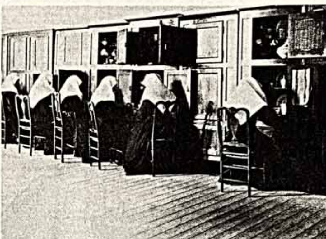
● Эдмонд Сакре, «Гентские монахи». (Гент, Бельгия). 1925 год.

И еще об одном неоспоримом достоинстве выставки: