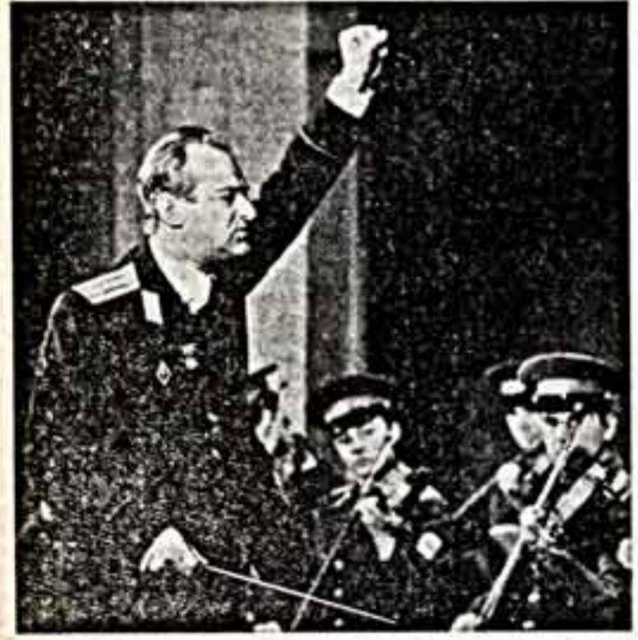
Во Дворце культуры автозавода имени Н. А. Лихачева с новой программой, посвященной XXVII съезду КПСС, выступила ансамбль вокально-инструментального ансамбля Московской области.