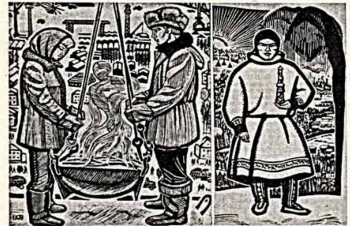
Последняя из его работ. Появилась творческая серия «Летопись». В ярких картинах, портретах людей разных специальностей, работающих на Севере.

● «На вахту». ● «Центр». ● «Тамбовская нефть».