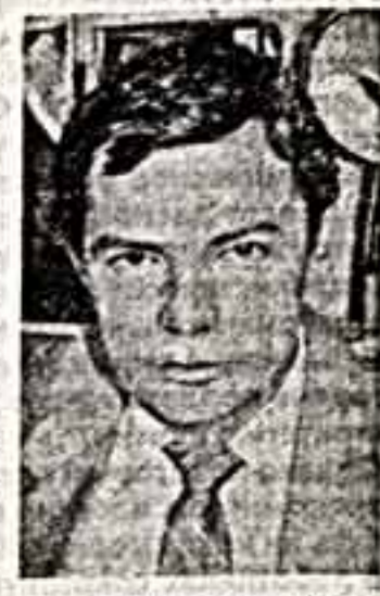
«Или мне больше достоверной истории, но причём. Мне хотелось рассказать о зрительском прозрении одного человека так, чтобы была услышана мысль о необходимости прозрения каждого. Уровень душой культуры личности не менял, а более важен, чем уровень его материального благосостояния. Сегодня на государственном уровне поставлен вопрос о человеческом прогрессе. Теперь чем активнее телевидение и другие средства массовой информации будут об этом говорить, тем быстрее эти идеи войдут в сознание каждого.»