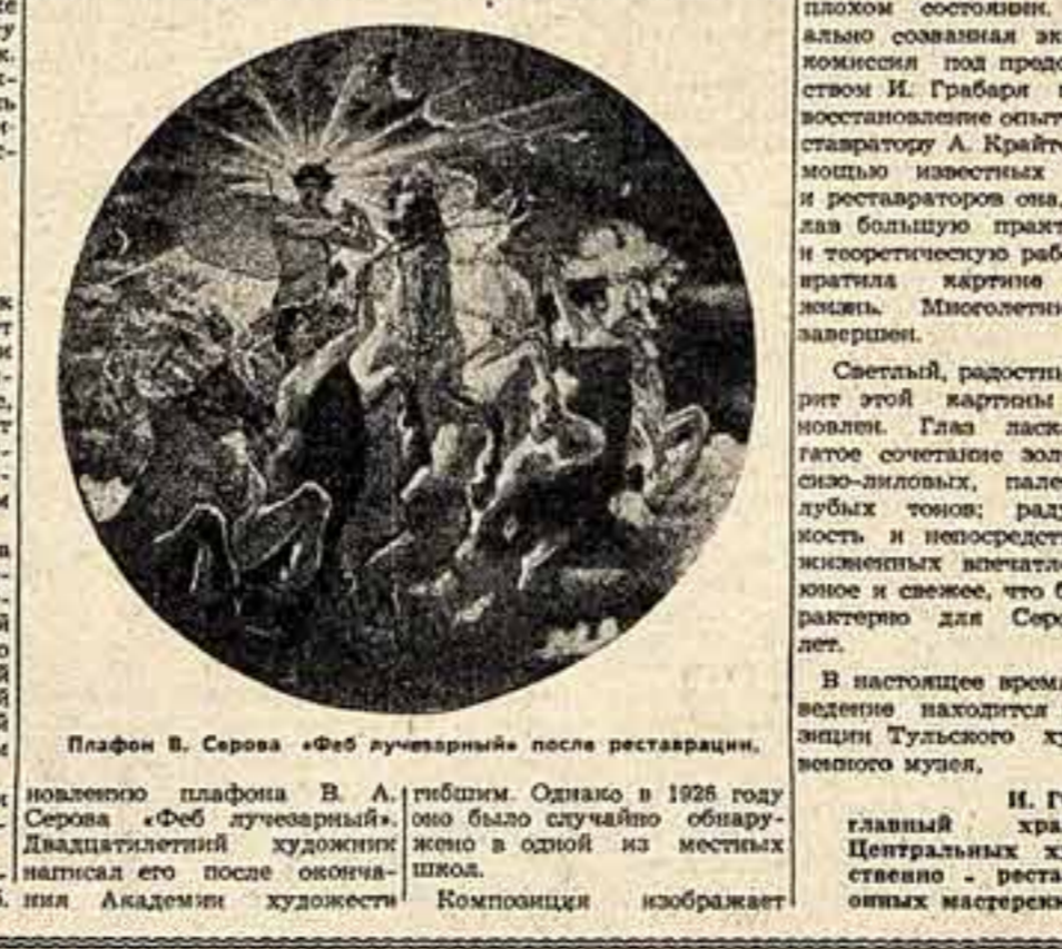
Портрет В. Серова «Фаб луваторный» после реставрации.

В течение последних лет внимание многих художников, искусствоведов и просто любителей живописи было привлечено к восста-