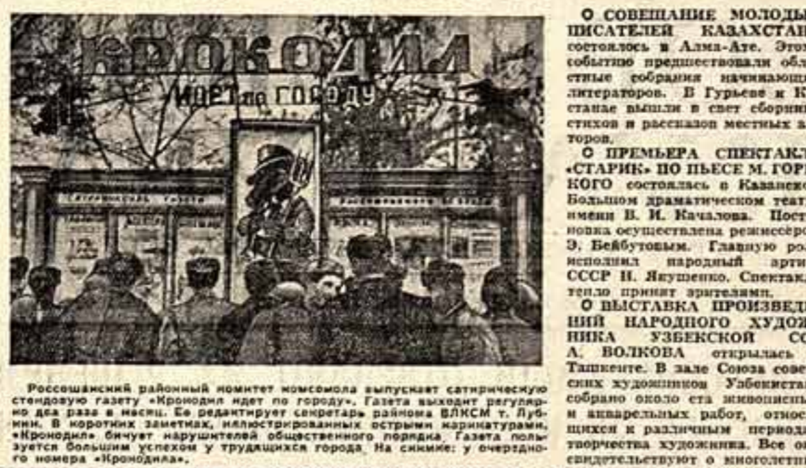
Россианский районный комитет молодежи выпускает сатирическую сатирическую газету «Иронидия» и ведет культурно-просветительскую работу в клубе. На снимке: у черной доски.