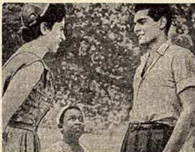
Кадр из фильма «Борьба в долине».

В Египте воспеваются произведениями советского кино, которые там хорошо известны. Обмен фильмами способствует укреплению дружбы между Советским Союзом и Египтом.