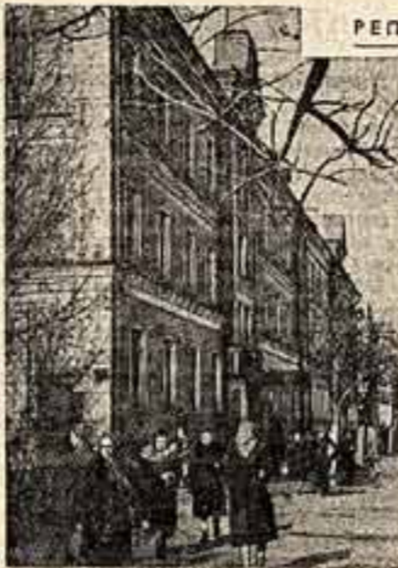
Дом № 2/79 по ул. Ленина.

Республиканским министерствам культуры поручено изучить состояние театральных мастерских на местах и принять меры к упорядочению их деятельности.