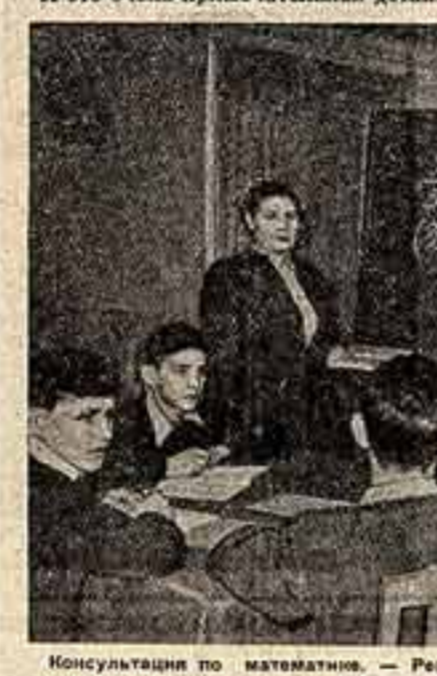
Консультация по математике. — Решают.

— Вот так бывает всегда в часы работы библиотеки. — А когда она открыта? — Два раза в неделю — по средам и воскресеньям. Впрочем, нет правил без исключения. Иногда открываю и в другие дни. Это не очень трудно. И вы, наверное, мы все тут живем, — раздались несколько голосов. — Это очень примечательная деталь.