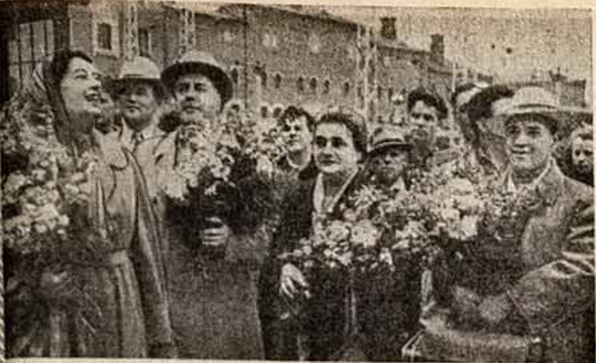
Встреча солистов Свердловского драматического театра на Казанском вокзале столицы.