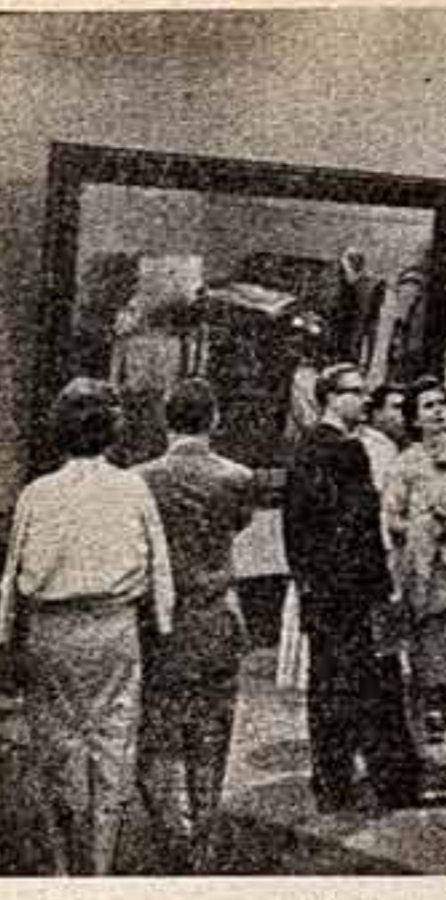
Советская выставка в Нью-Йорке. Осмотр произведений советских художников и скульпторов.

Григорий РОШАЛЬ, кинорежиссер, народный артист РСФСР.