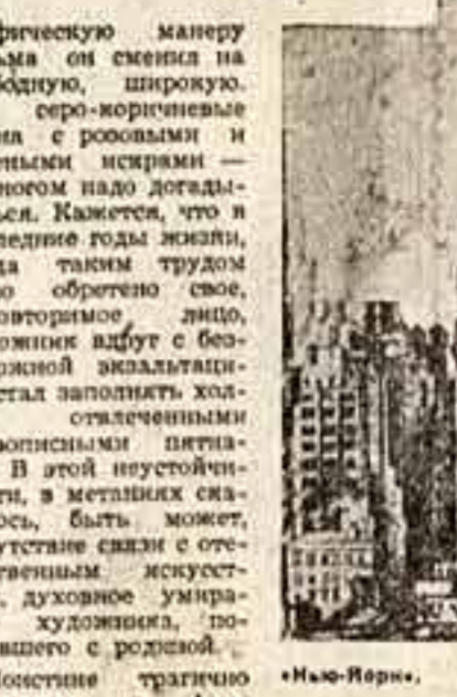
Нью-Йорк. Рисунки автора.

Вещи, вещи, вещи. Вещи, вещи, вещи. Вещи, вещи, вещи. Вещи, вещи, вещи. Вещи, вещи, вещи.