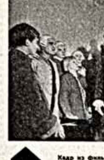
Кадр из фильма «Михайло Ломоносов».