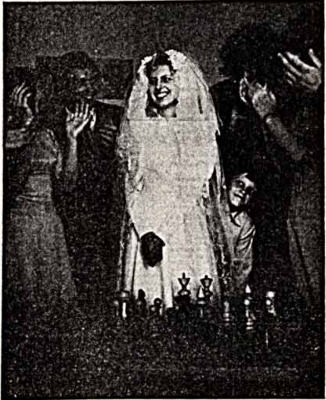
А. ДАКЯВИЧУС. «Вызражка партии».