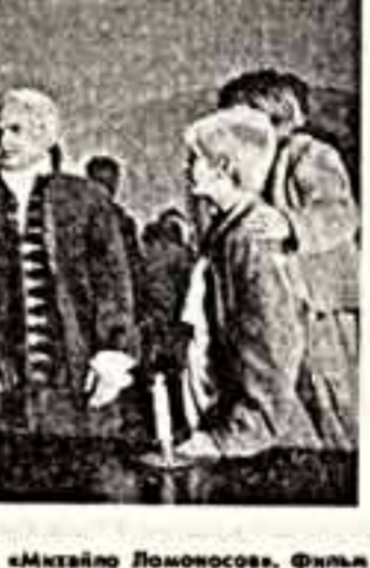
Кадр из фильма «Михайло Ломоносов».