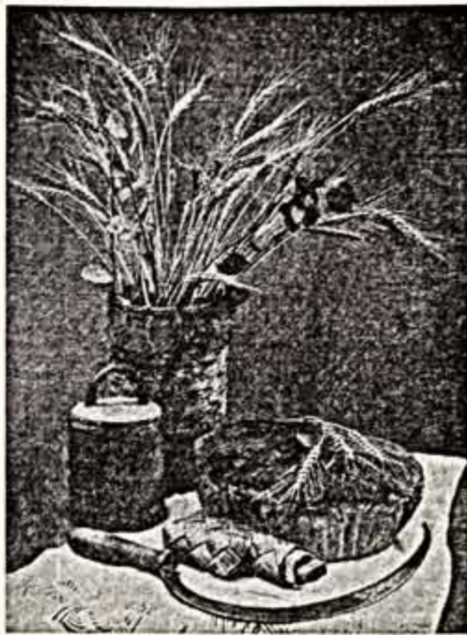
Хлеб — всему голова во все времена.