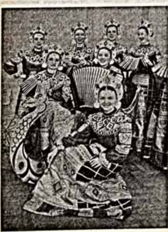
Когда в воронешском доме культуры «Электроника» проходит репетиция народного вокального ансамбля «Воронешские узоры» и народное хореографическое ансамбль «Юность», ощущается атмосфера творческой составляющей. Показке на сцене ансамбля «Воронешские узоры» — уже леса. Любимый вид турецкого традиционного народного творчества — мехариша украшена из серебра. Эту простую гладиолусную посуду для хлеба безострыет ее автор — юнчик из Ретенево Давид Васильевич.