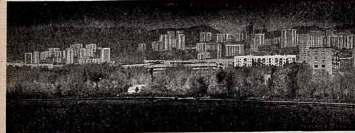
Перед жилищными республиками встал сложная задача планировать быстро растущие города и реконструкцию старых городских районов. И они с честью справляются с решением этих задач. По проектам грузинских архитекторов была обета в бетоне Куря, сооружены новые мосты в Тбилиси, построены многочисленные жилые массивы, дворцы культуры, кинотеатры, курортные комплексы. Строится новый жилой район Тбилиси.