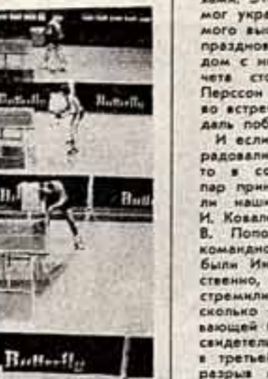
Общий вид зала.

Три дня в столичном универсальном спортивном зале «Дружба» проходили матчи. Маленькие, белые, упругие шарик, подпрыгивая ударом ракетки, словно молнии, пересекали ограниченное пространство над столами, разделившись сетками на равные части.