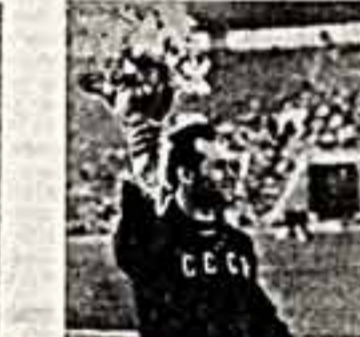
Валерий БРУМЕЛЬ, заслуженный мастер спорта, олимпийский чемпион, экс-рекордсмен мира по прыжкам в высоту, он же автор сценариев художественных фильмов и повестей.