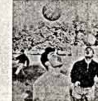
Зураб СОТКИЛАВА, футбольный комсомолец «Динамо» (Тбилиси), он же солист Большого театра Союза ССР, народный артист СССР.