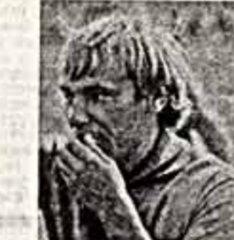
Сергей ШАКУРОВ, мастер спорта по акробатике, известен также как актер Драматического театра имени К. С. Станиславского, заслуженный артист РСФСР.