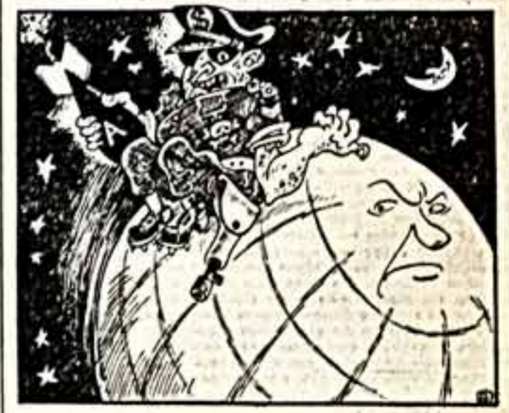
— А это мой ядерный атомный!