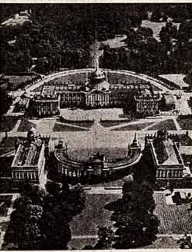
Сан-Суси. Вид на Новый дворец.

Постепенно от спецгруппы откомандировывались офицеры, серванты и солдаты, и объекты охраны передавались вновь образованному дворцово-парковому управлению.