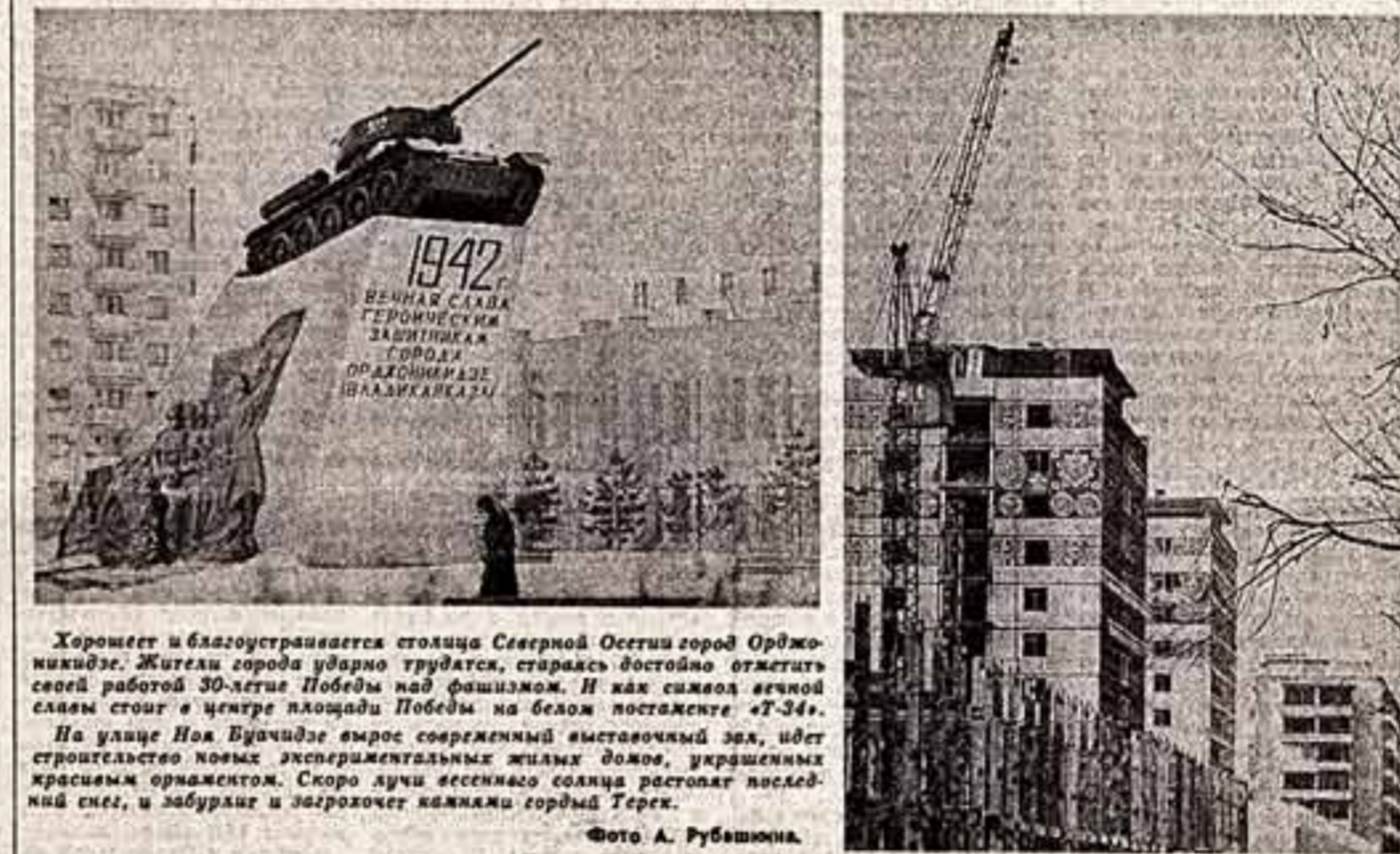
Хорошеет и благоустраивается столица Северной Осетии город Орджоникидзе. Жители города ударно трудятся, стараясь достойно отметить свой 30-летний юбилей Победы над фашизмом. И как символ вечной славы строя в центре площади Победы на белом постаменте «Т-34» на улице Нов Юностицы вырос современный выставочный зал, идет строительство новых экспериментальных жилых домов, украшенных яркими орнаментами. Скоро здесь будет соляная шахта, которая даст местным жителям и заборам и закроет каменья гордый Терек.

В связи с истечением очередного срока полномочий высших органов государственной власти союзных и автономных республик, а также местных Советов в стране развернулась подготовка к выборам в Верховные Советы союзных и автономных республик, в краевые и областные, городские и районные, сельские и поселковые Советы депутатов трудящихся. Начались формирование и уточнение избирательных округов, создание избирательных комиссий. Нет никакого сомнения в том, что миллионы советских людей в день выборов — 15 июня отдадут свой голос за кандидата веруемого блока коммунистов и беспартийных, за дальнейшее процветание нашего общественного и государственного строя, нашего социалистического Отечества.