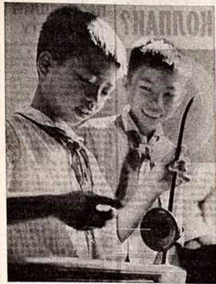
Большое внимание уделяется в Демократической Республике Вьетнам художественному воспитанию подрастающего поколения. В стране работает много специализированных учебных заведений культуры. Ученики класса народных инструментов Ханойской музыкальной школы обучаются игре на однострунной вьетнамской гитаре.