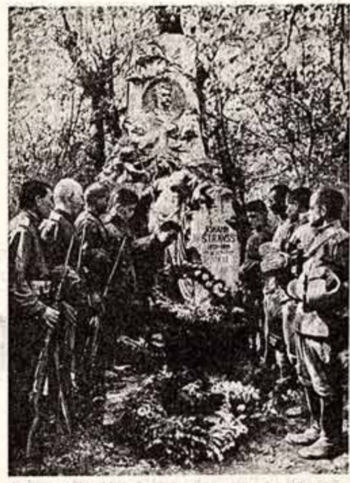
Вена, 1945 год. Советские воины у могилы И. Штрауса.