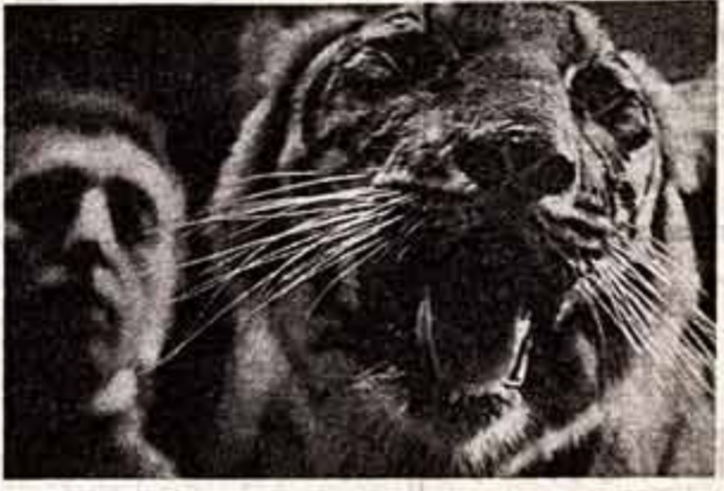
фотоконкурс Ю. СОНОВ. «Эта цирка!» (Тирис Ш. Демисова).