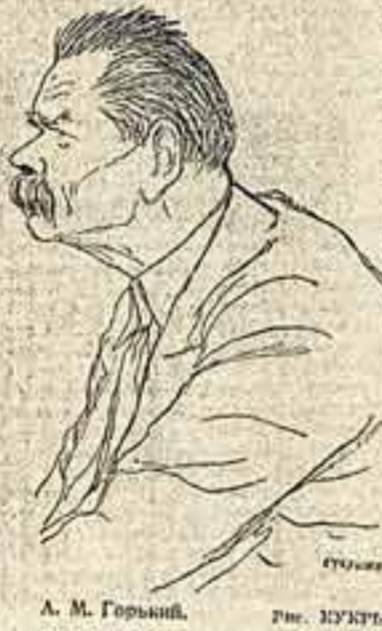
А. М. Горький