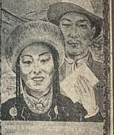
ГОЛОСУЙТЕ ЗА КАНДИДАТОВ БЛОКА КОММУНИСТОВ И Б. ГОЛОСУЙТЕ ЗА НОВЫЙ РАСЦВЕТ СОВЕТСКОЙ