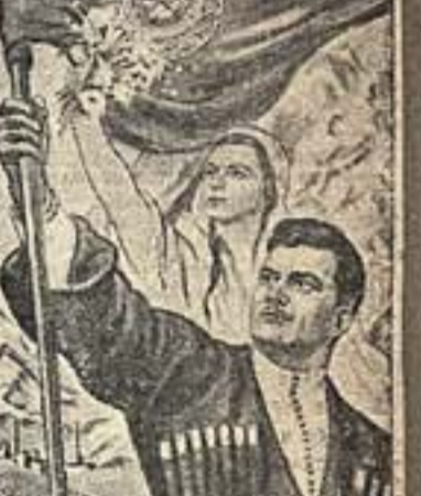
ГОТОВЬТЕ ЗА ДАТЯНСКИМ РАЙОНОМ СОВЕТСКОЕ ПРИБЛИЖЕНИЕ К ПЕРВОМУ РАЙОНУ ГОРОДА САРАТОВА