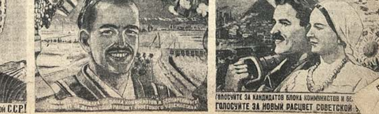
Все на выборы в Верховный Совет Туркменской ССР!