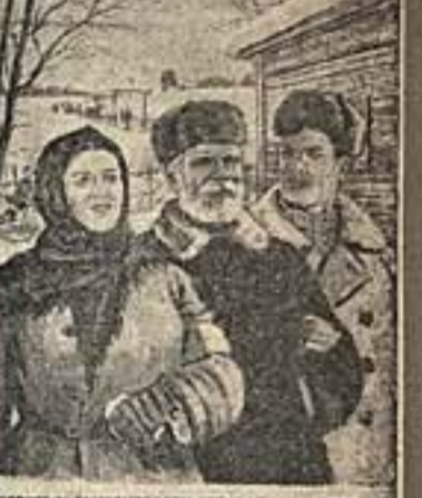
ПОДГОТОВЬТЕ ЗА ДАТЯНСКИМ РАЙОНОМ СОВЕТСКОЕ ПРИБЛИЖЕНИЕ К ПЕРВОМУ РАЙОНУ ГОРОДА САРАТОВА