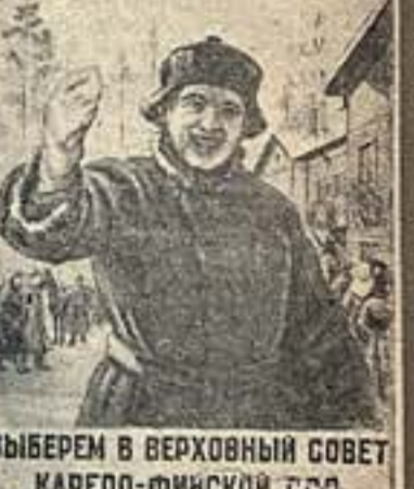
ВЫБЕРЕМ В ВЕРХОВНЫЙ СОВЕТ КАРЕЛО-ФИНСКОЙ ССР ЛУЧШИХ СЫНОВ И ДОЧЕРЕЙ НАШЕЙ РЕСПУБЛИКИ!