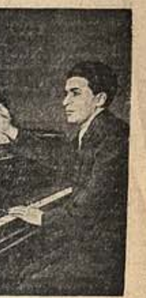
Композитор А. Гаджиев.

И. БЕРСЕНЕВ, народный артист РСФСР, художественный руководитель Театра им. Ленинского комсомола