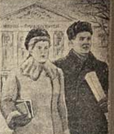
ЗА СЧАСТЛИВУЮ ЮНОСТЬ ГОЛОСУЕТ СОВЕТСКАЯ МОЛОДЕЖЬ!