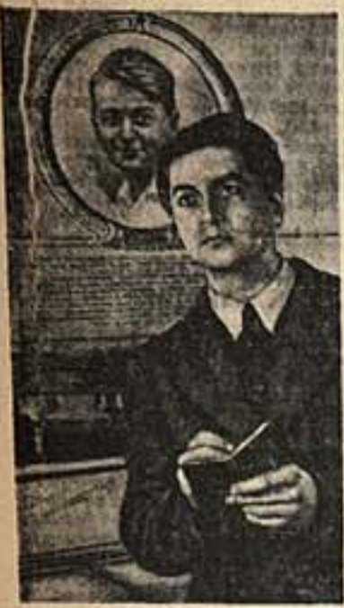
Артист Юрий Любимов знакомится на выставке «Комсомола и молодежи в Великой Отечественной войне» с материалами о героях Краснодара.