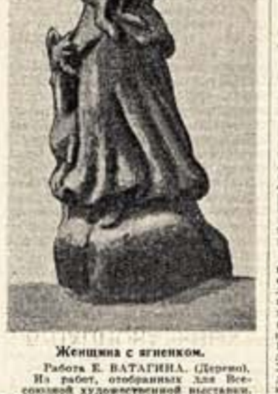
Женщина с вилочком. Работа Е. ВАТЯГИНА (Пернов). На работ, отобранных для Всесоюзной художественной выставки.

Утверждает проект восстановления бывшего здания «Ресторан» (опионов Лермонтовский в «Князь Марин»). Это величественное каменное здание с тридцатых годов прошлого века по проекту петербургского архитектора Шарлемана. В последние годы здесь размещался государственный Балнеологический институт. Немедленно фельдшерский госпиталь и другие учреждения, а также выделены средства на восстановление здания.