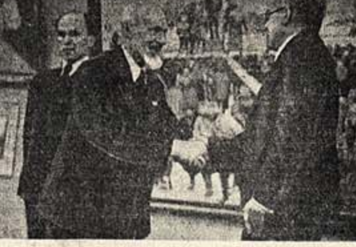
На открытии выставки картин К. Ф. Юона. Скульптор М. Маннер присутствует К. Ф. Юон от имени Оргкомитета Союза советских художников.