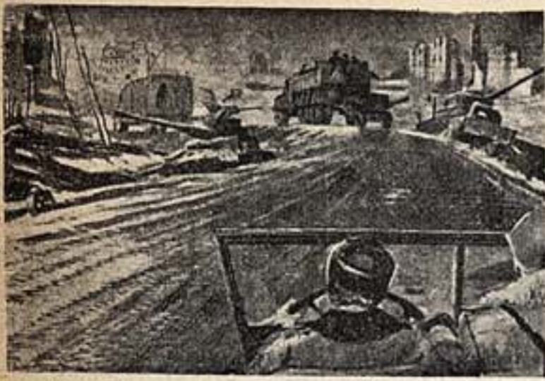
Фронтальная дорога. На работ, отобранных для Всесоюзной художественной выставки.