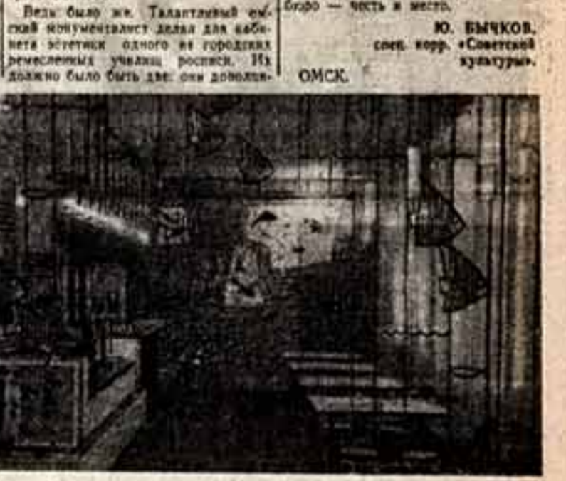
Фрагмент интерьера клуба кордион Фабрики (Омск). Г.

Вот он, печальный результат эстетического общества. Матрица, который должен был стать эталон красоты, превратился в распад клубного вкуса. Значит, совершенно очевидно, как это делается во всех случаях жизни, в технике, медицине, космонавтике и т.д., прежде чем приступить к делу, надо иметь дело, или надо объяснить, что это такое, а не просто сказать, что это такое. Многие сложные работы в интерьере, выполняемые строителями клубной культуры. Тут, конечно, квалификация, требовалась и духа, способная творить красоту.