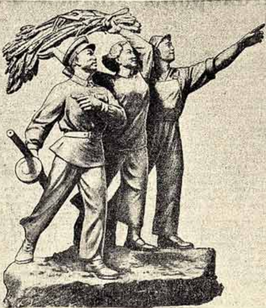
В печати опубликованы материалы о Ленине, а также выдержки из его произведений.