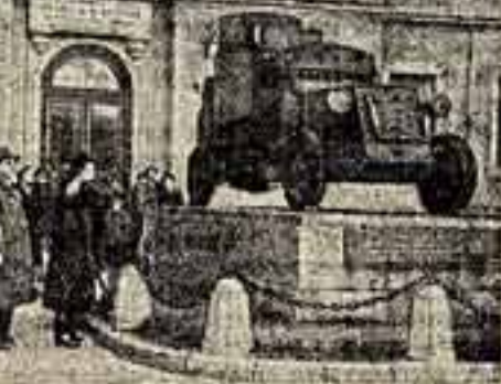
В ленинградском филиале Центрального музея В. И. Ленина экскурсанты осматривают исторический бюрократ, с которого 3(16) апреля 1917 года выступал В. И. Ленин.

Как драгоценные реликвии, хранит советский народ квартиры, где жил и работал гениальный вождь пролетарской революции. Только за минувший год их посетило более 150 тысяч человек.