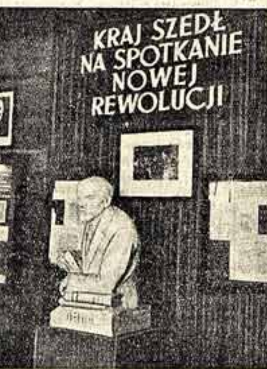
В деревне Белый Дунаец близ Поронино Ленин бывал в летнее время в 1913 и 1914 годах. Здесь проходили партийные совещания. Квартира Ленина в Белом Ду-

нае превращена в сельский Дом культуры. Здесь есть красивый уголок, библиотека, проведена электричество, радио. На втором этаже сохранена обстановка рабочего кабинета Ленина: стол, пишущая машинка, лампы, две дерюжанные кровати, накрытые дерматиновыми ковриками, и полка с книгами.