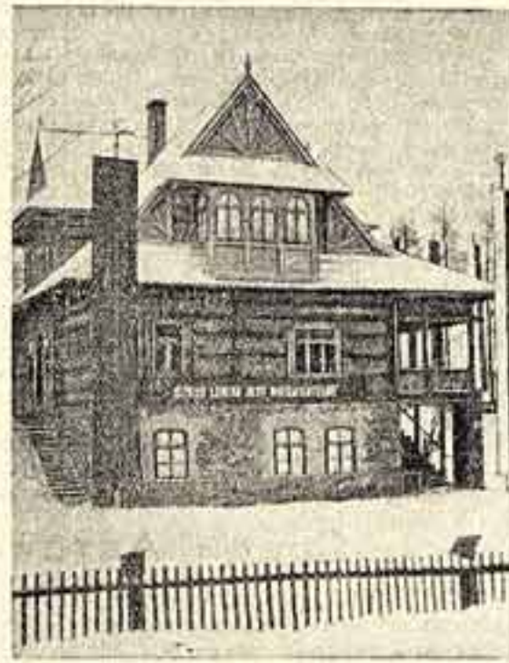
Владимир Ильич в связи с болезнью Н. К. Крупской вынужден был поселиться в деревне Поронино, он писал родным: «На днях переехал мы... на лето в горы, в деревню Поронино, в 7 км.

В Кракове Ленин жил вначале на улице Звезинец в доме № 218, на ул. Любомирских в доме № 47 и затем в доме № 51. На этих домах вывешены мемориальные доски. На доме № 16 по ул. Шляской висит мемориальная доска, напоминающая о том, что здесь Ленин прочитал доклад «Современная Россия и рабочее движение».