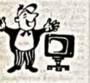
ТЕЛЕГИД «СК» РЕКОМЕНДУЕТ