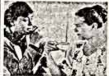
М. Караченцов и М. Неелова в кинофильме «Дамы приглашают кавалеров».