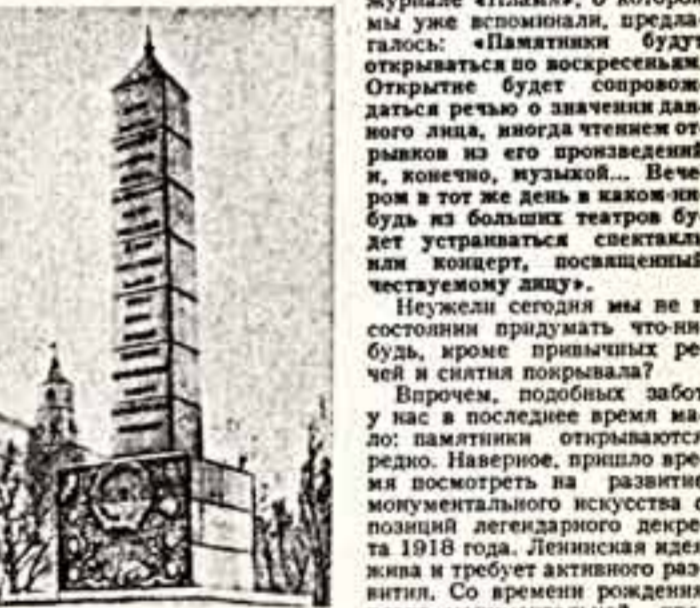
Чаше всего это не только разорительно для бюджета, но и изюном по художественному уровню. Как говорили в древности, не сумел сделать хорошо, сделал плохо.

Моменты воздвигаются сегодня не временные, как в 1918 году, а на века. Их сооружение требует современной производственной базы. Но в то-то и дело, что все это производство вместо низшему развитой индустрии, находится на полудиком уровне. Нам, художникам-монументалистам, недостает производственных площадей, качественных материалов, квалифицированных кадров рабочих. Поэтому если говорить о монументальной пропаганде в наши дни, о воплощении замыслов Ленина и их творческой реализации, то давайте говорить с ленинской деловитостью и принципиальностью, как практически решить назревшие проблемы. Задача для — создание индустрии монументального искусства.