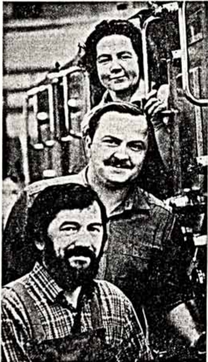
Продукция Московской фабрики офсетной печати Союзполиграфпрома хорошо известна в нашей стране. Успешно завершил XI пятилетку, печатники решили в новой пятилетке увеличить производительность труда на 29,4 процента...

Трудящиеся Советского Союза! Воплотим в жизнь исторические решения XXVII съезда КПСС! (Из Призывов ЦК КПСС).