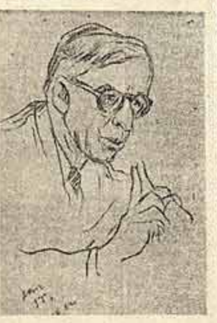
Осенью прошлого года народный художник РСФСР Н. Жуков побывал в составе делегации детской советской скульптуры в Англию. Во время путешествия по городам этой страны художник делал наброски для серии людей, с которыми ему довелось познакомиться, зарисовывая исторические места, связанные с именами Маркса, Энгельса, Ленина, с памятью Шекспира, Бернса, Дарвина.