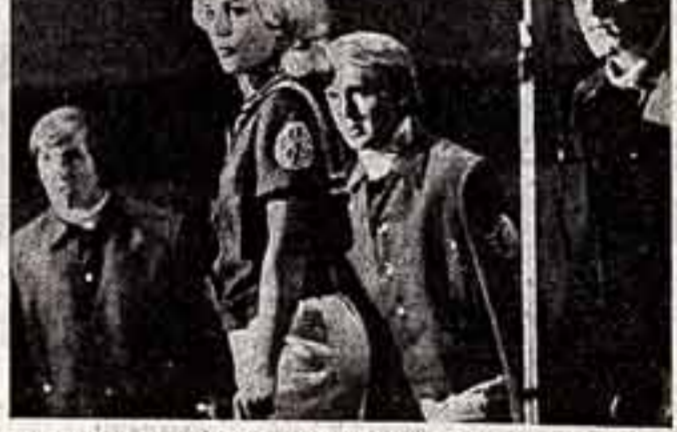
Выступает могилевский народный эстрадный ансамбль «Улыбка».