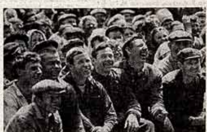
Концерт в обеденный перерыв.