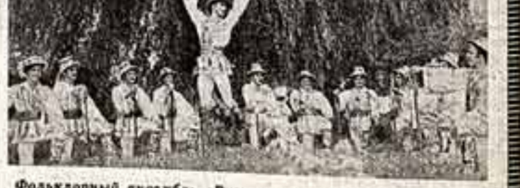
Фольклорный ансамбль «Румынская расподия».