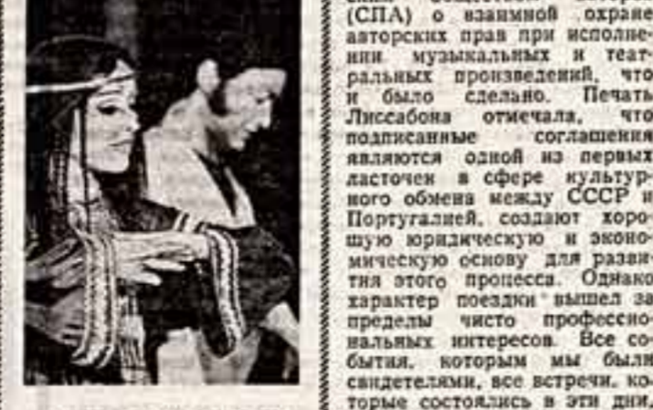
Актриса Андреа Драго в роли Шахерезады.