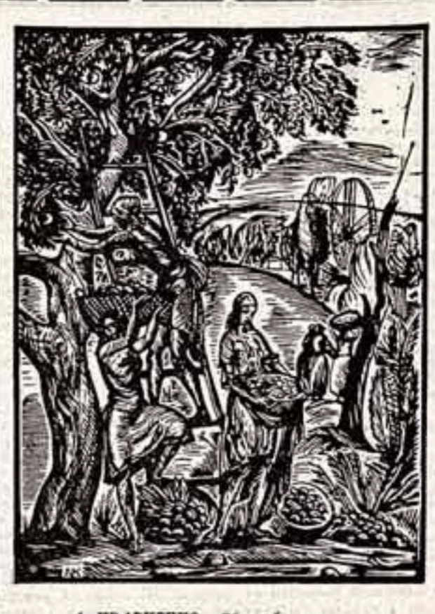
А. КРАВЧЕНКО. «Сбор яблок».

После Свердловска выставка поедет дальше по Сибири и Зауралью, посетит Ульяновск и закончит свое путешествие в Дальнем Востоке.