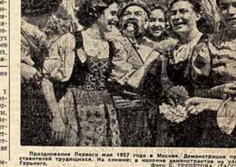
Празднование Первого мая 1957 года в Москве. Демонстрация представителей трудящихся. На снимке: в колонне демонстрантов на улице Горького.

Огромное впечатление оставил у всех физкультурный парад. Разноцвет ветер шелковые знамена спортивных обществ. Идут штангисты, теннисисты, фехтовальщики, плаватели, легкоатлеты, гребцы. Валетают мячи над волейбольными сетками, составляют команды баскетболистов, метко бьют по воротам (не то что на стадионе!) футболисты. С еще большей силой пре-