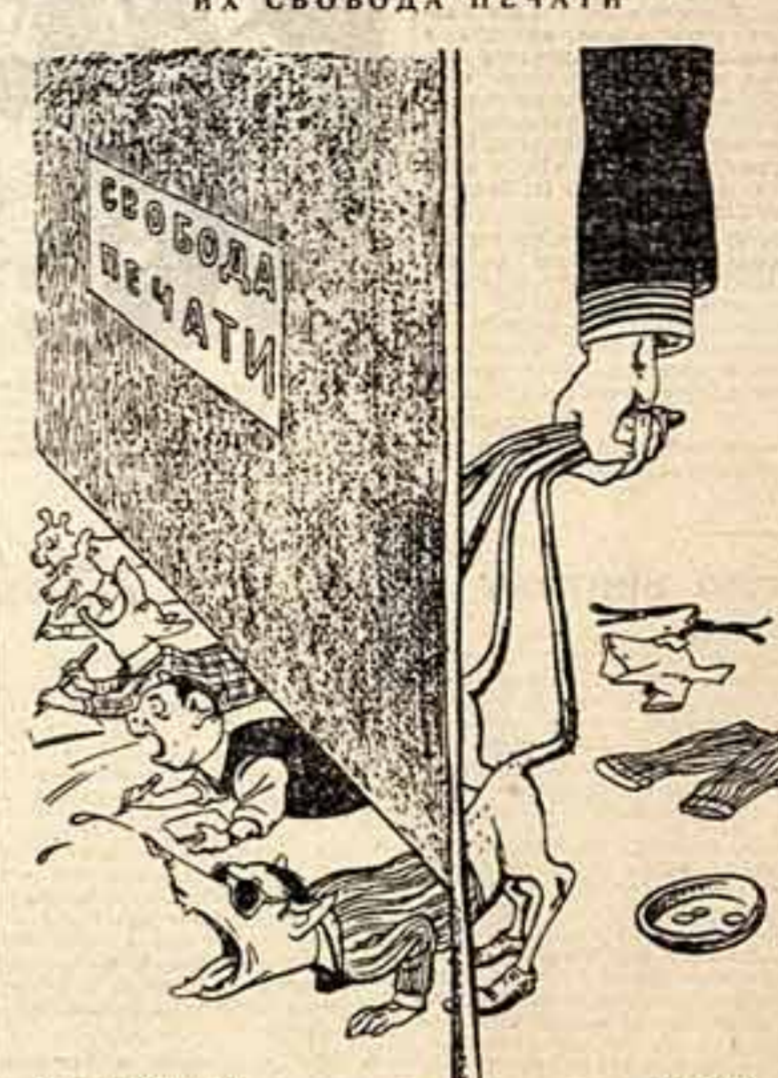
ИХ СВОБОДА ПЕЧАТИ

После совещания мы опубликовали редакционную статью, в которой подвели итоги дискуссии. В статье