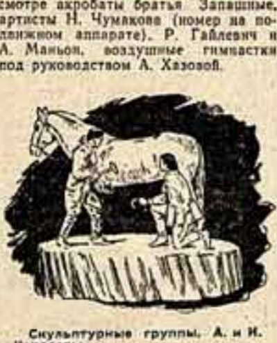
Скульптурные группы. А. и И. Королев. Рисунки С. АИДЗЕВА.