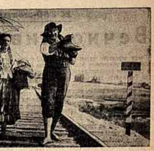
Кадр из фильма «На podmestных сценях».