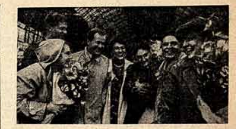
13 июля в Москву после гастролей в Югославию, Болгарию и Румынию возвратились артисты МХАТ имени М. Горького. На снимке: артистка МХАТ имени М. Горького.

На совещании присутствуют представители министерств культуры союзных и автономных республик, руководители театров и заведующие литературной частью. Участники совещания заслушали доклад И. Васильева «Об итогах прошедшего театрального сезона и задачах на предстоящий сезон 1956/57 г.» и В. Питомина «О новых пьесах советских драматургов». Со-