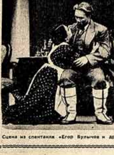
Сцена из спектакля «Егор Булычов и другие», размышлений о путях в жизни.

Именно сейчас, в эти годы, происходит переворот в сознании тысяч крупных и мелких собственников. У каждого из этих людей сломан старый и привычный путь. И вот в это время в Пенкине появляется на сцене пьеса о Егоре Булычове, человеке, страстно и болезненно размышляющем о своем пути и судьбе мира, в котором он живет. Понятно, что интерес он вызывает необыкновенный.