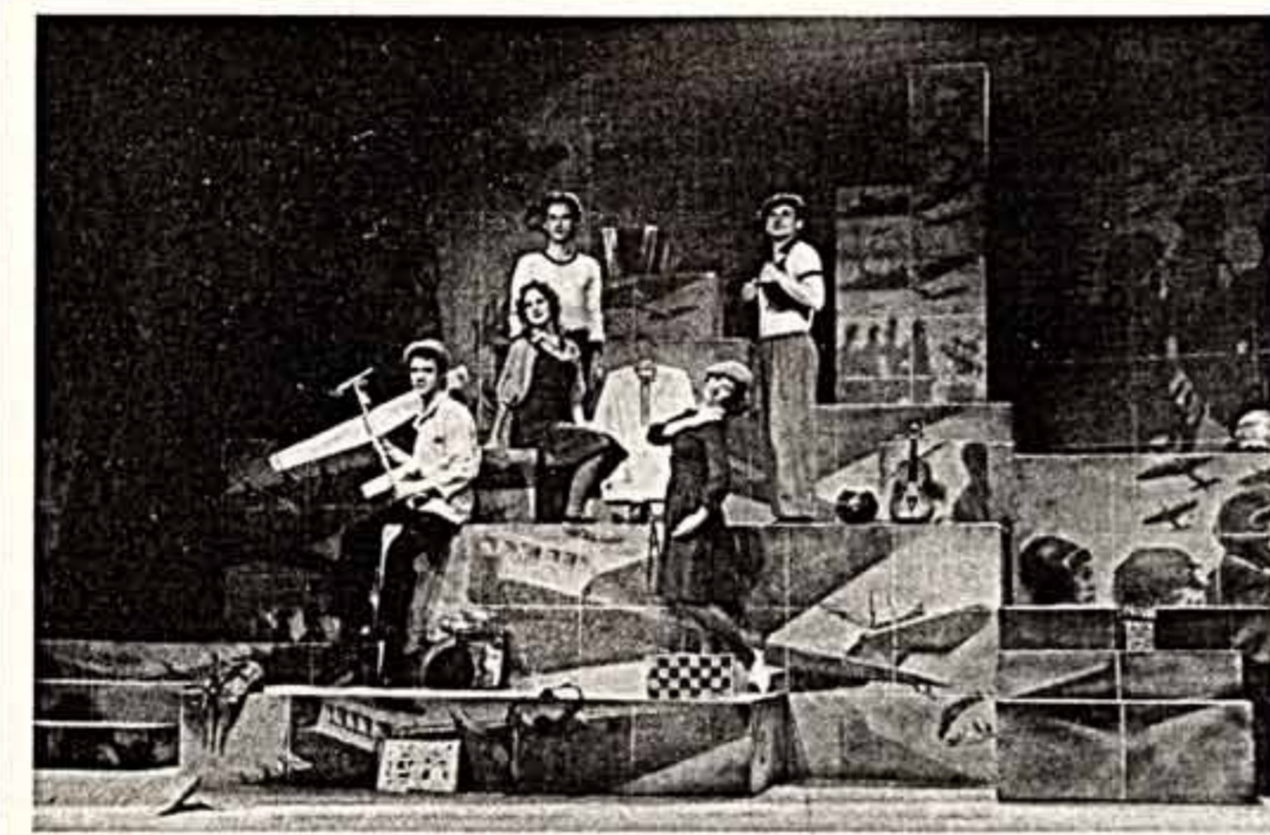
Сцена из спектакля Римского театра оперы «Андрея» в. В. В.