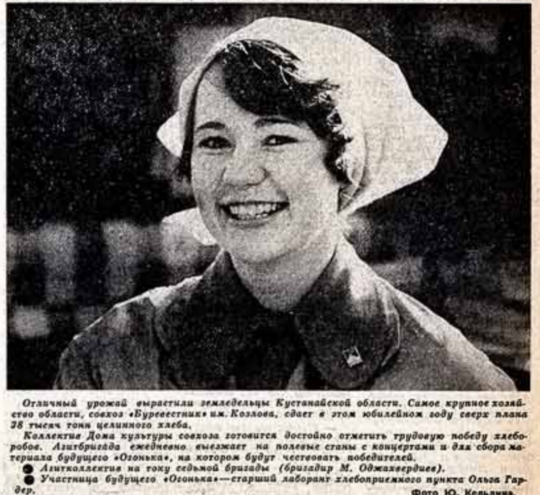
Отличный урожай вырастили земледельцы Кустанайской области. Самое крупное хозяйство области, совхоз «Буревестник» им. Коллово, соберет в этом юбилейном году сверх плана 38 тысяч тонн целинного хлеба.

Фестиваль молодежных театров и молодежных спектак-