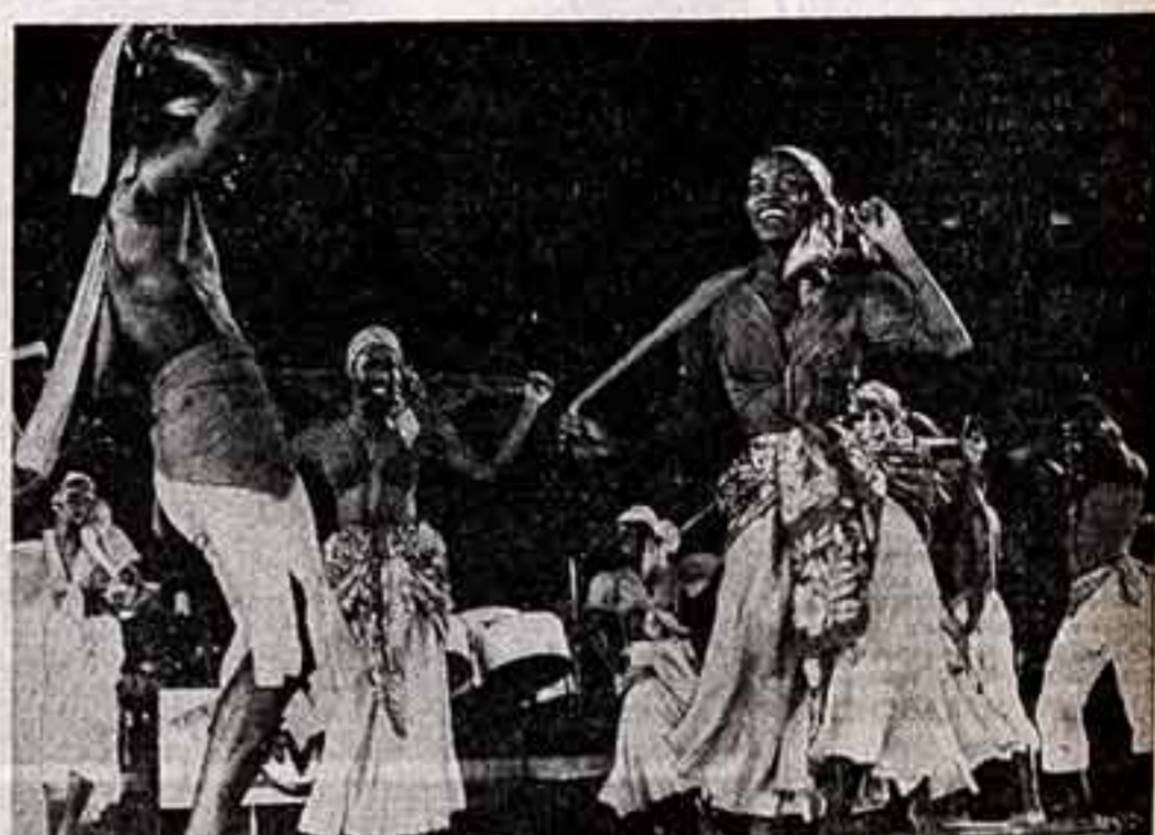
Триптих и «Табак» — легендарное государство, расположенное в бассейне Карибского моря на одноименных островах. Выступает национальный ансамбль песни и танца.

Вышел в свет первый номер газеты «Варна», официальная газета Варнанского фронта национальной обороны на языке индийского народа. Впервые в истории страны.