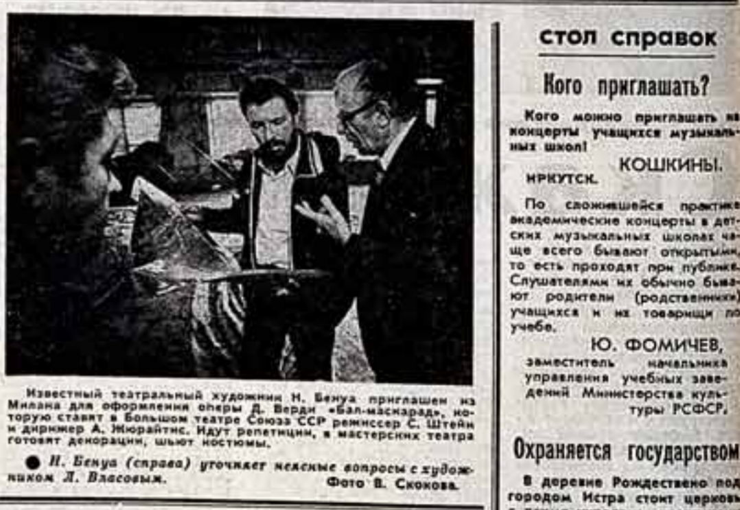
Известный театральный художник М. Буня проработал в оформлении оперы...