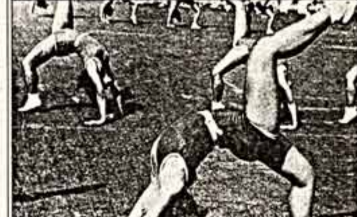
«История Москвы — история московской фотографии»

Н икаких достоверных свидетельств о том, что Москва существовала до изобретения фотографии, у нас нет. В самом деле, только фотографии расширили границы нашего видения за пределы нашей жизни. Только она показала нам старую Москву, в которую мы не могли поверить.