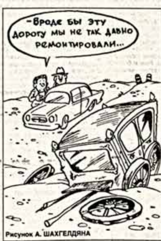
Рисунок А. ШАХГЕДЯНА

давать. Спасибо, конечно! Но разве не дешевле починить светофор, чем беспокоить лейтенанта, да еще платить ему при этом, вместо светофора, зарплату?