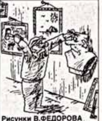
Рисунок В. ФЕДОРОВА

Из газетных заголовков: "Прикройтеесь, обнаженные". "Патриоты спомались на сексе". "Пиво с пощечинной". "Высокая" поэзия Черкизовского молочного завода на рекламных щитах столицы: "Если это пил Иван (Поддубный), значит нужно пить и вам". Афиша: "Поет обладатель премии Овация, Суперэкстравагантный певец, Принц Серебряный, Прима России Сергей Паникин".