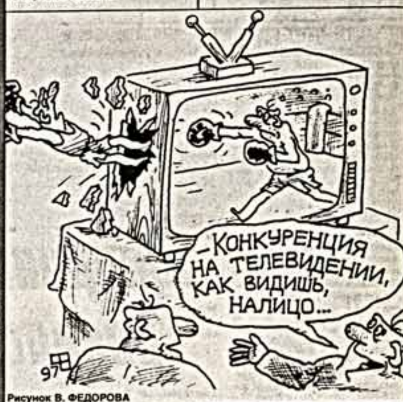
Рисунок В. ФЕДОРОВА