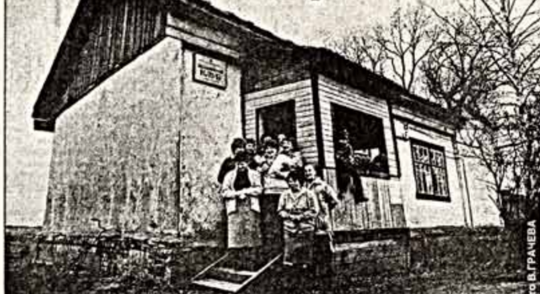
Собор В. ГРИЗЛОВА