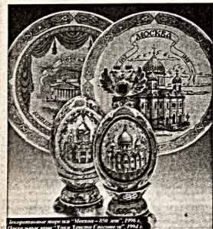
Декоративные тарелки «Москва — 850 лет», 1994 г. Пасхальное яйцо «Гресь Троицы Живоначальной», 1994 г.