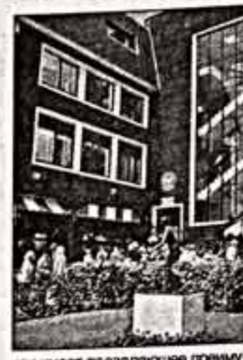
По материалам зарубежной печати