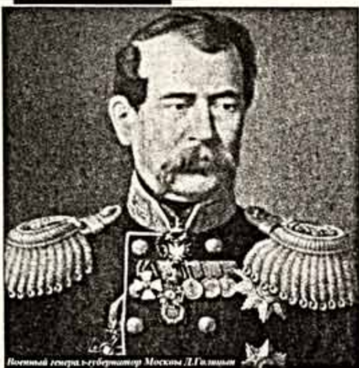
Почетный генерал-губернатор Москвы Д.В.Голицын