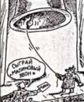
Рисунок В. ФЕДОРОВА