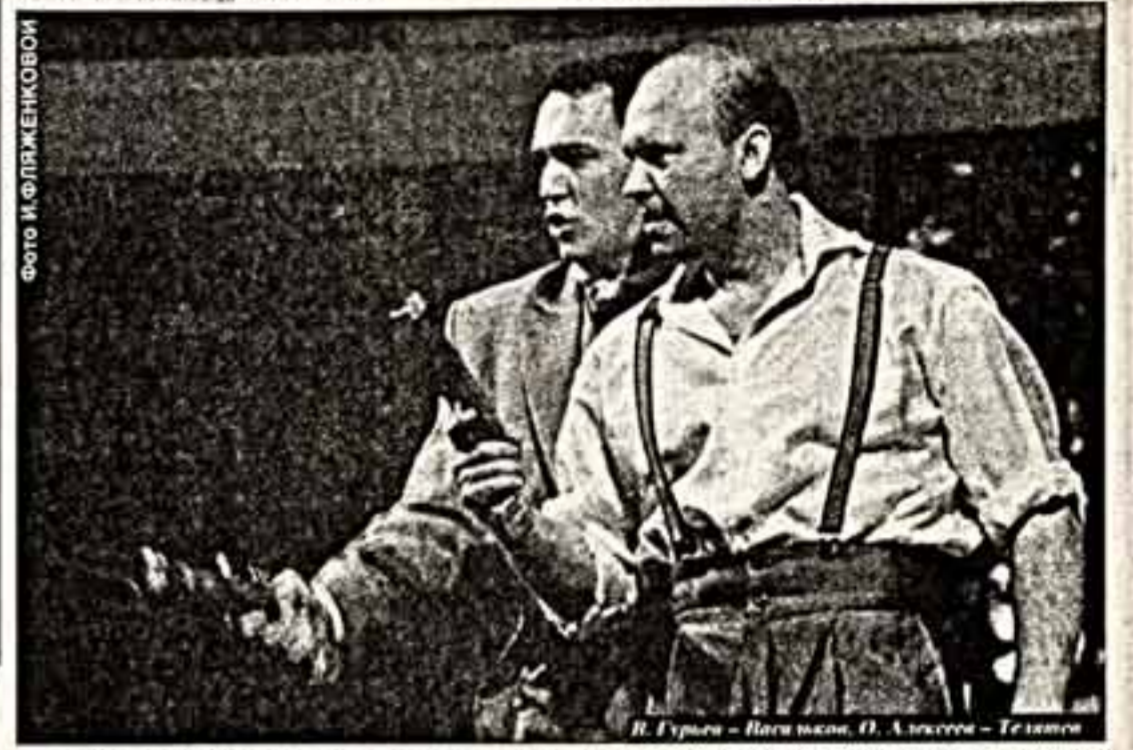
Ю. РЫБАКОВ — ВИДЕОСЪЕМКА. О. АЛЕКСЕЕВ — ТЕАТРОМ

По художественному классу этот спектакль не чета, конечно, ни "Ромео и Джульетта", ни