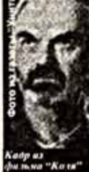
Колга из фильма “Коля”

Прага встретила дуэт Свараков с распростертыми объятиями. После прошлогодних ярких побед, наград, золотых медалей чемпионов мира хоккеистов и серебряных — футбольной сборной на европейском первенстве — Чехия снова на слуху. На сей раз в области культуры. Выразил свое восхищение успехом “Коли” президент-интеллектуал Вацлав Гавел. Со своей стороны министр иностранных дел Йозеф Желенец отметил вклад создателей фильма в “форми-