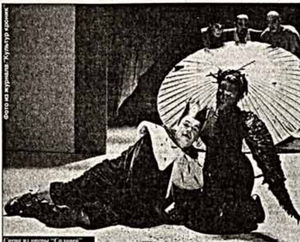
Четверг из оперы "Соловей"