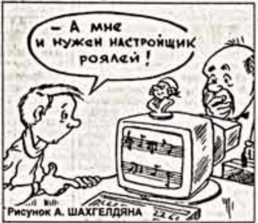
Рисунок А. ШАХГЕЛДЯНА

При обилии зарубежных серверов, посвященных "классике", Россия пока еще отстаёт. Мелкие странички, на которых размещено десять строчек ин-