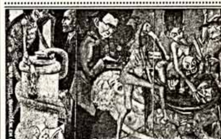
Одна из удивительных фламандских картин Питера Брейгеля старшего “Танец смерти Веймар”