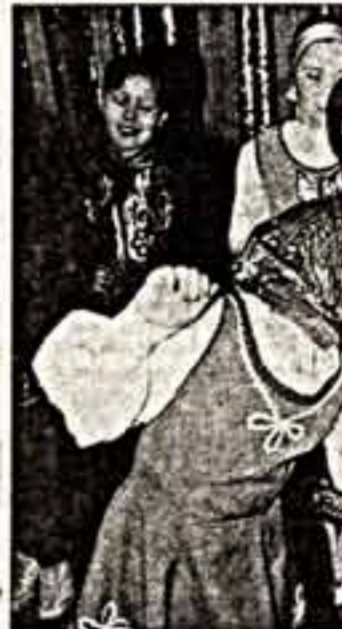
Собор В. ГРИЗЛОВА