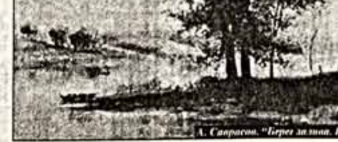
А. Саврасов. "Берег залива. Рыбаки у костра"

Листая аукционный каталог, всматриваясь в оригиналы, а тому порукой экспертиза, проведенная "Купиной" в Третьяковской галерее, Пушкинском музее и других крупнейших центрах образовательного искусства, убеждаешься, что арт-рынок в современных условиях несет в себе некую исследовательскую функцию и одновременно просветительскую. В России художественный уровень аукционного предложения гораздо выше, нежели на Западе. Свидетельство тому представленные коллекции в двух ведущих российских антикварных домах — "Телос" и "Купина".