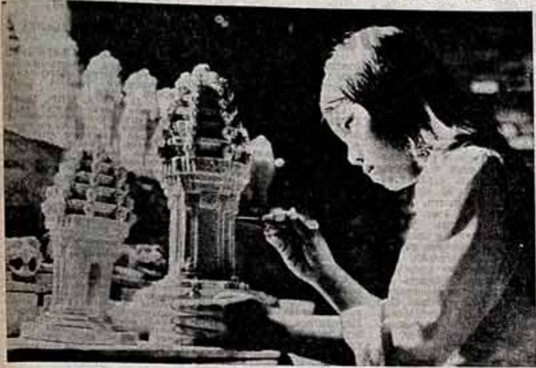
Камлужа издавна славилась своим искусством резьбы по дереву, керамике, художественной росписи. Древние ремесла Народной Республики Камлужа своим качеством до сих пор уходят в глубь истории страны и народа. Наделя народными мастерами отличаются красотой и выносливостью и свидетельствуют о тонком вкусе мастеров.