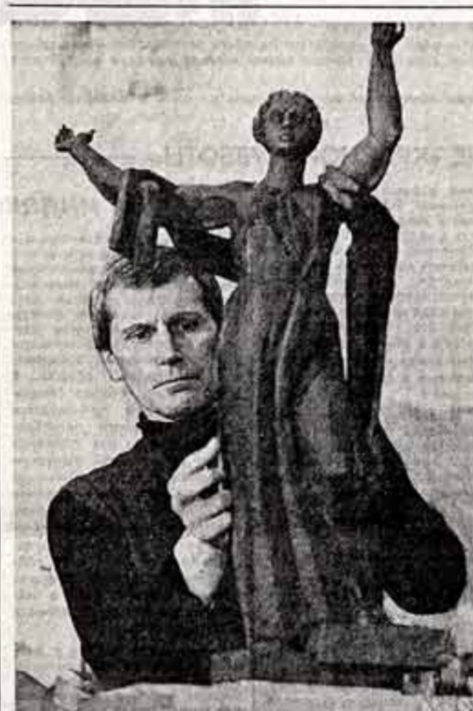
Возведение величественного обелиска в честь города-героя Минска...