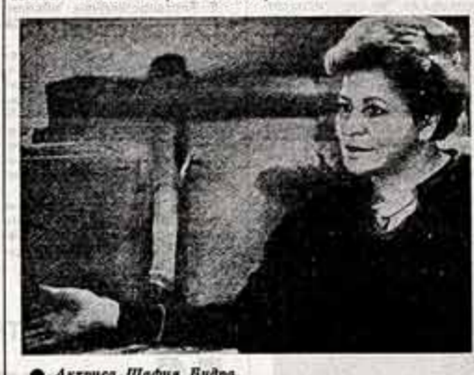
Актриса Шафия Буадра.