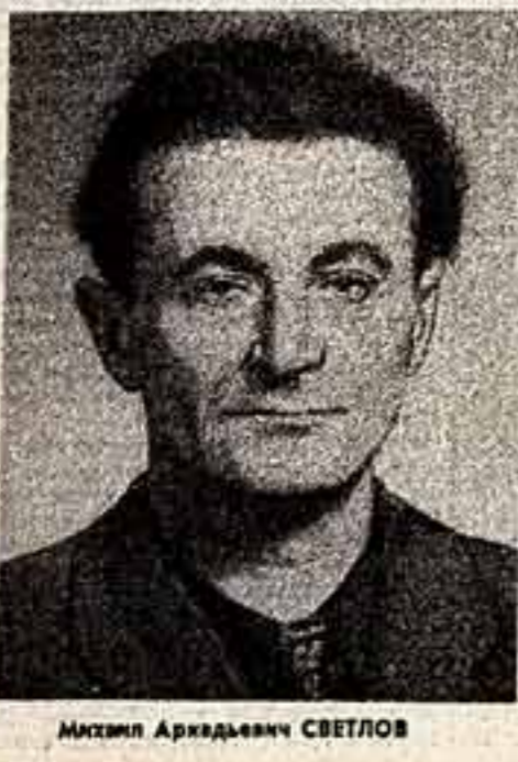
Михаил Аркадьевич СВЕТЛОВ