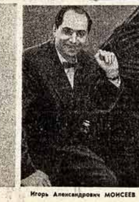
Игорь Александрович МОИСЕЕВ