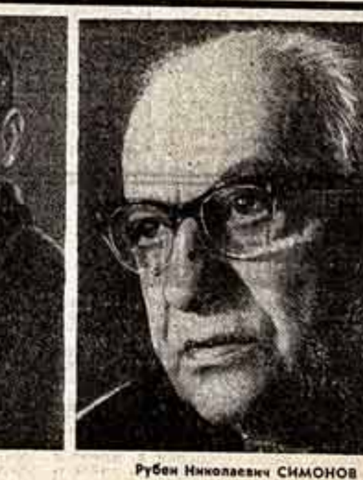
Рубен Николаевич СИМОНОВ