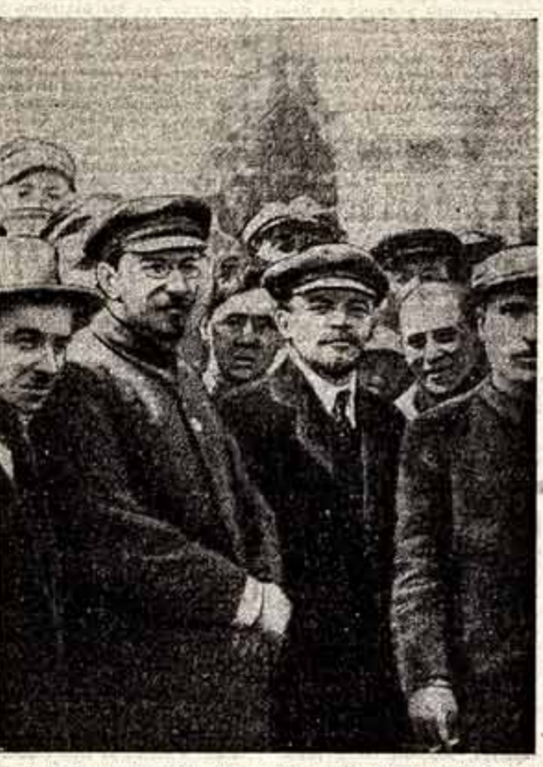
В. И. Ленин и А. В. Луначарский на заседании памятника освобожденному труду. 1 мая 1920 г.

Итак, перечислю факты участия В. И. Ленина в решении вопросов изобразительного искусства и архитектуры.