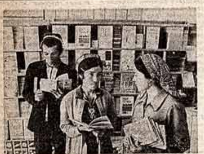
Поселок Гаруты— центральная усадьба совхоза имени XXIII съезда КПСС Колхозабдского района Таджикской ССР...