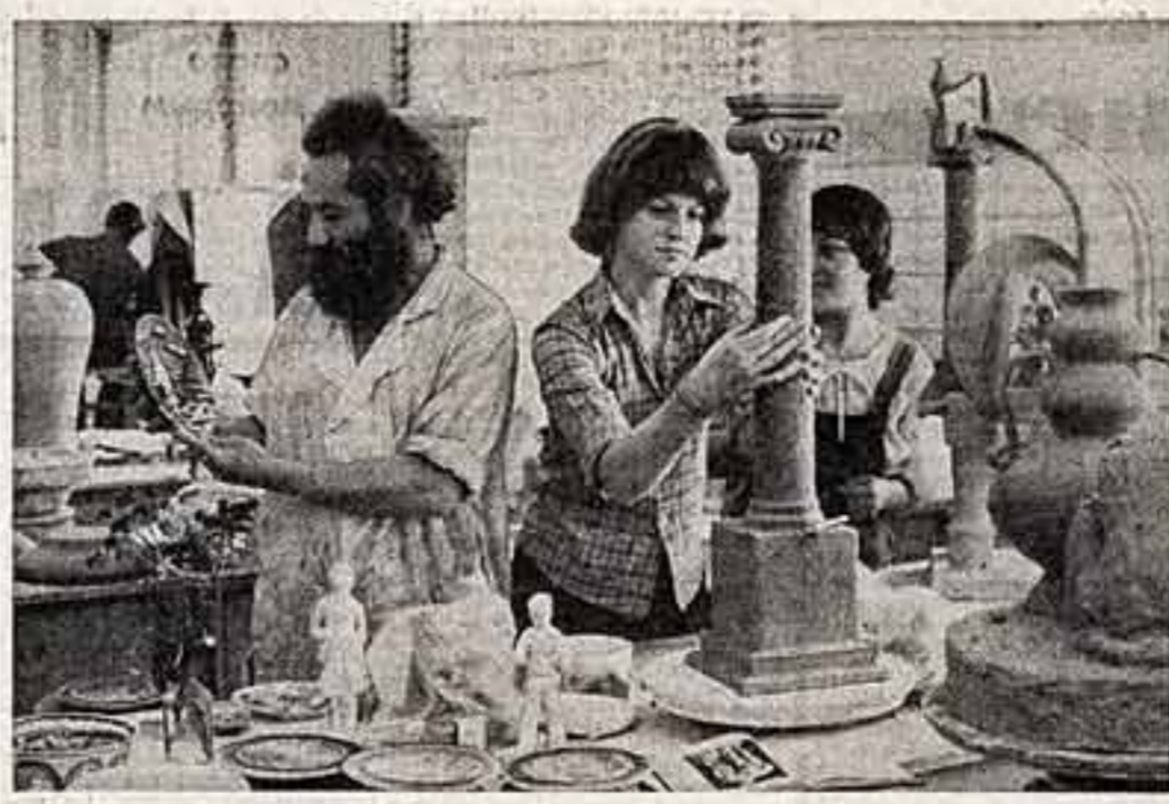
Красивые гонимые изделия, сестальники, люстры, торшеры, ковальные украшения, выделанные способом горячей эмали, создают мастера творческого-производственного комбината Художественного фонда РСФСР.