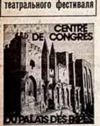
Вокруг площади Башенных часов

«Доверено музыке» — так называется новый цикл спектаклей-концертов Одесской филармонии, посвященный выдающимся композиторам.