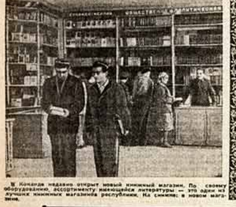
В книжном магазине открыт новый книжный магазин. По своему оборудованию, ассортименту...