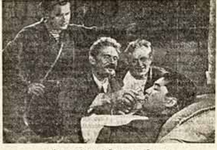
Кадр из фильма «По путевке Ленина».