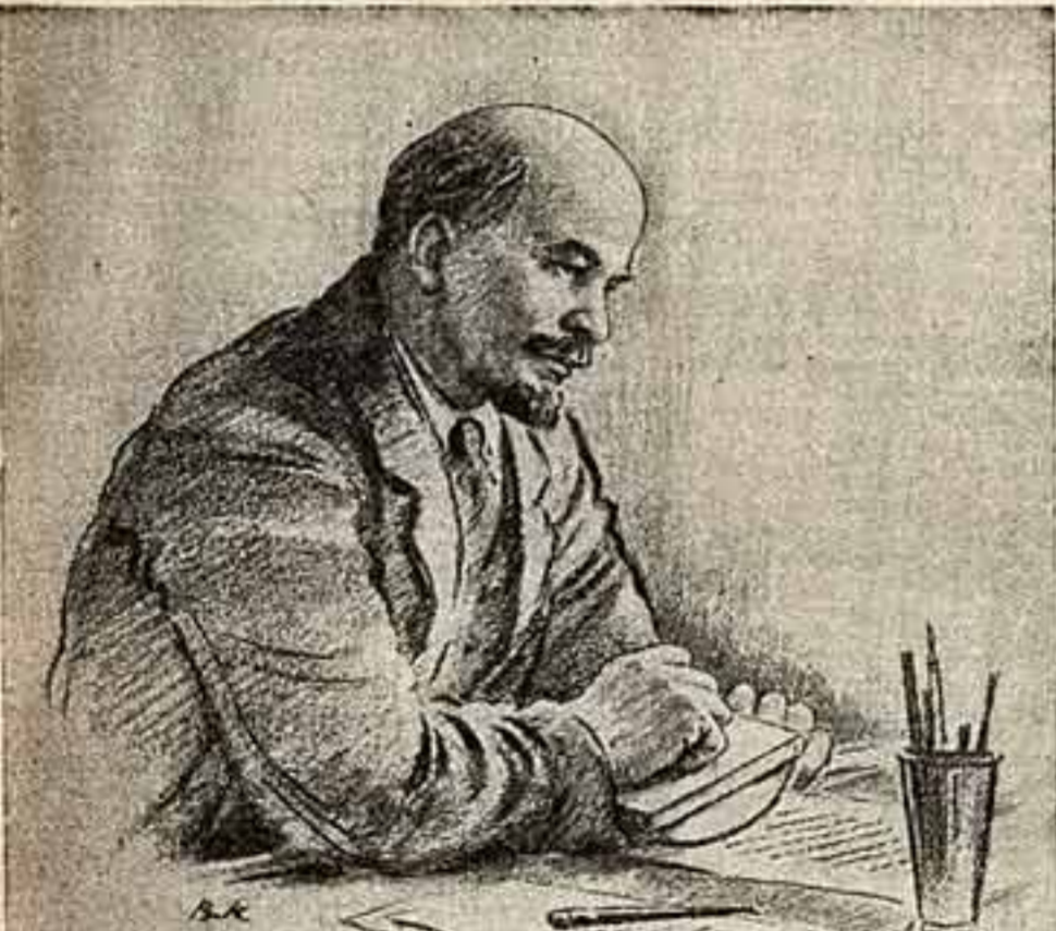
В. М. ЛЕНИН.