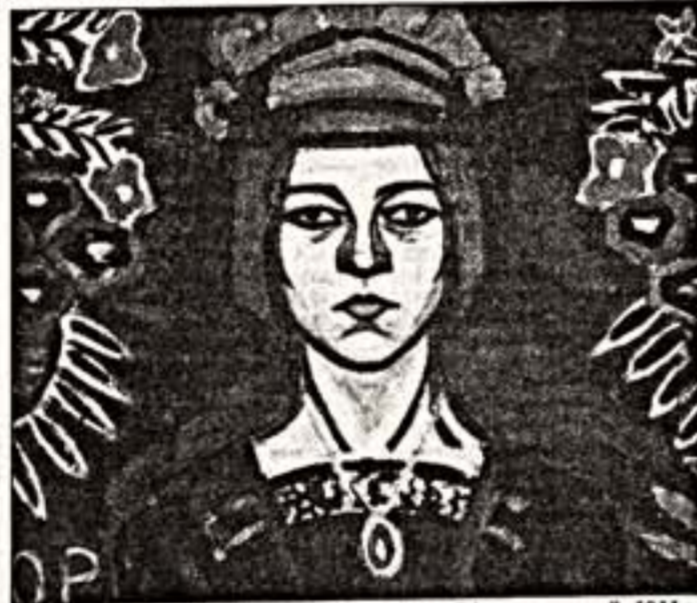
О. Розанова. "Аэропорт", 1911 г.