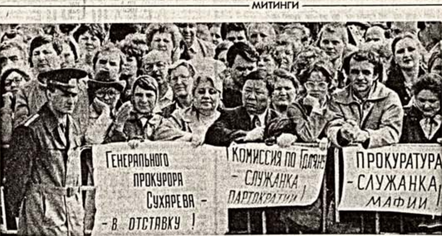
ГЕНЕРАЛЬНОГО ПРОКУРОРА СУХАРЕВА - В ОТСТАВКУ! КОМИССИЯ ПО ГОЛЫНУ - СЛУЖАНКА ПАРТОКРАТИИ! ПРОКУРАТУРА - СЛУЖАНКА МАФИИ.