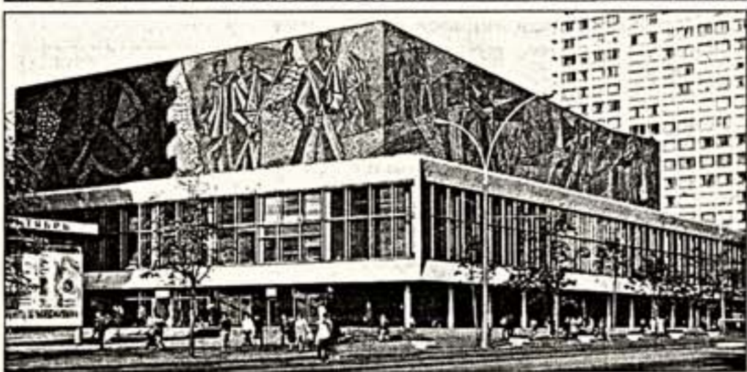
Сверху вниз: В.М.Васнецов. "Богатыри". 1881—1898 гг.; А.М.Васнецов. "Семибашенная усадьба Белого города". 1924 г.; А.В.Васнецов. Мозаика на здании кинотеатра "Октябрь". (Совместно с Н.Андроновым и В.Алькошиным). 1967 г.