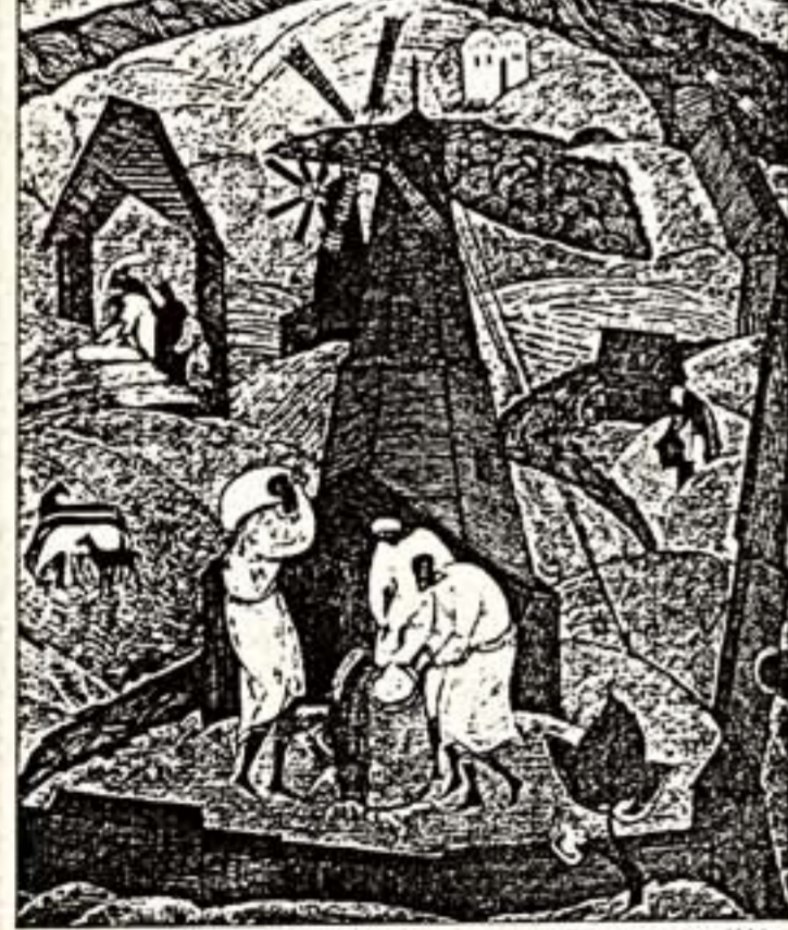
М.Борисов. "Посвящение". Триптих. Первая часть. 1991 г.

Объединились две художественные династии