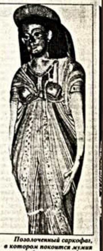
Положенный саркофаг, в котором покоится мумия богатой египтянки