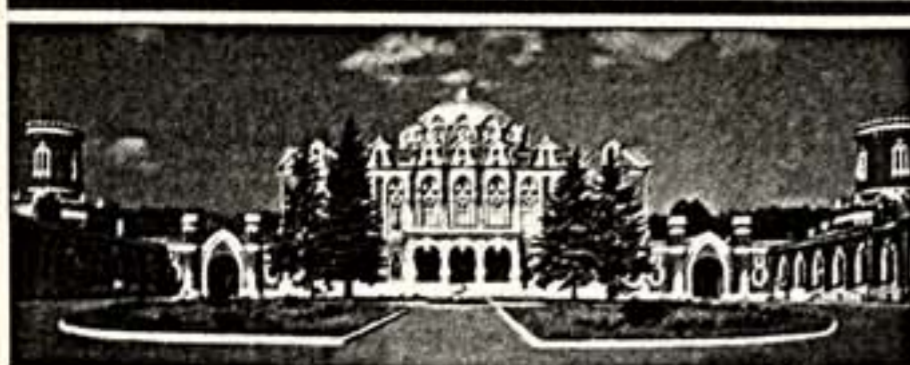
Вверху: Петровский путевой дворец; В центре: вид на Кремль со стороны Замоскворечья. Литография XVIII в. Внизу: Государственный музей изобразительных искусств им. А.С.Пушкина