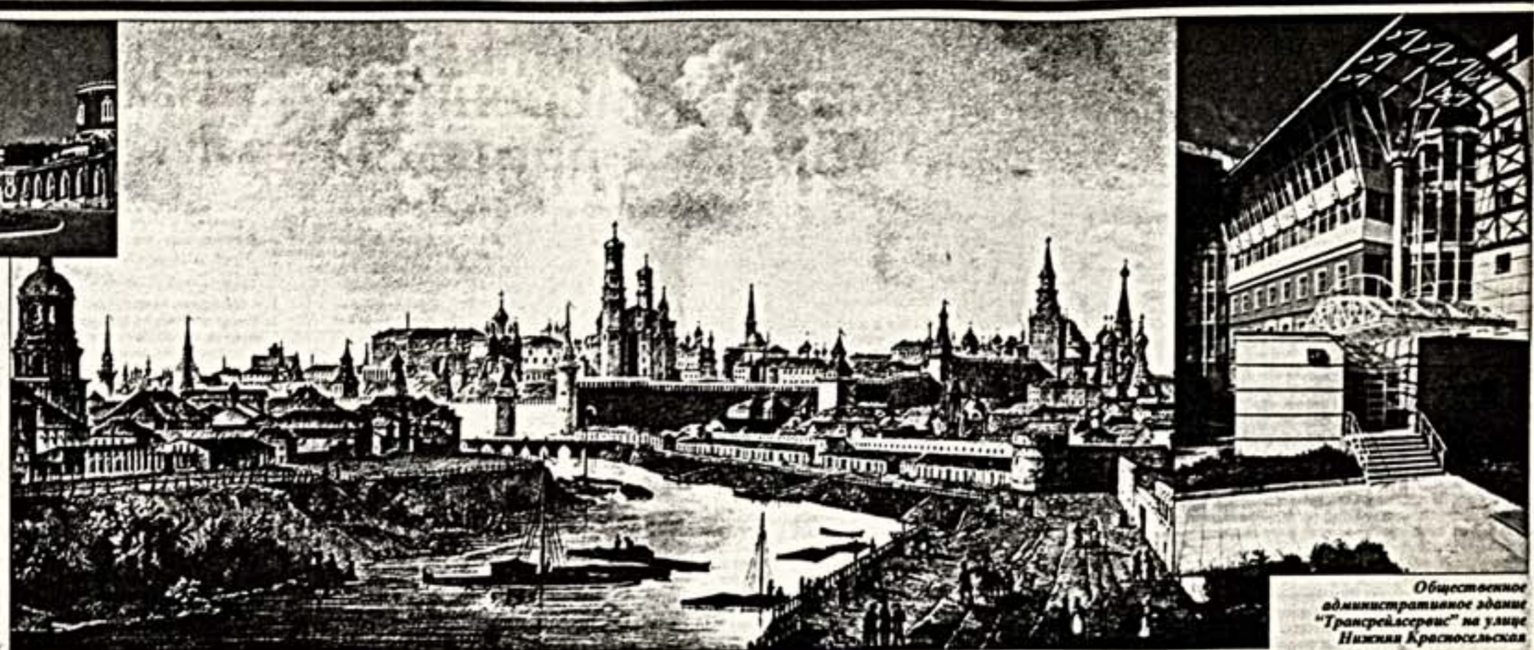
Общественное административное здание "Трансрассервис" на улице Нижняя Красносельская