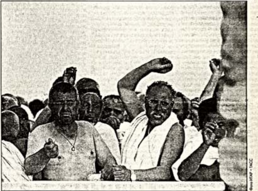
На мосту в Мекке — предместье Мекки во время исполнения обряда «любавания бьюлом камнями»