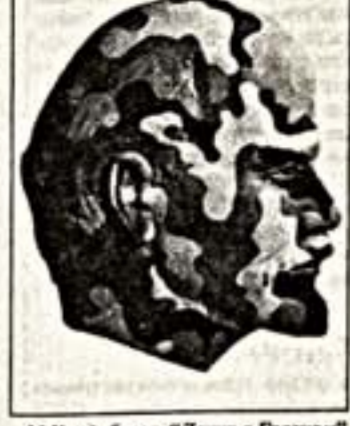
М.Колдобская. "Ленин в Грузии"

Небольшая экспозиция представляет работы 17 художников разных поколений, направлений и политических пристрастий. Обширная претенциозная выставка, один из фигурантов, Вадим Войнов, утверждает, что "своевременное искусство" — антипод современному искусству. То есть нечто противоположное искусству модному и коммерчески успешному. Что в устах петербургского художника звучит снисходительно. "Современное искусство". Однако даже беглый взгляд на выставленные работы позволяет за-