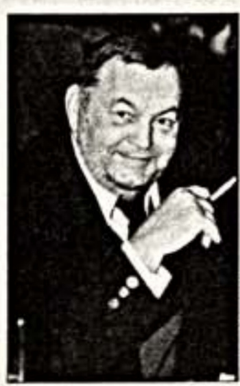
Сам Никита Михалков не добился творческого вытост.

Чтобы не воровать. Чтобы был политиком. Чтобы был не очень старым и не очень молодым. Чтобы был здоровым. Чтобы не болел членомышцами. Чтобы был козырем. Именная карта русского человека о козырях. Сам не могу, но козырям должен сиять. Коллективный кинематографический компьютер на сызде, перебрал все возможные варианты, выдал единственный: надо звать Никиту Михалкову. Как ни обидно, но сегодня в кинематографическом сообществе не нашлось даже развудной альтернативной кандидатуры. И Михалков попросил тайм-аут в четыре месяца, чтобы подготовить программу. Сегодня все с нетерпением ждет его, как и ответа на главный вопрос: "Какой союз нужен гражданам?" Для чего люди соединятся в союз? В первую очередь для того, чтобы создать для каждого члена организации режим наибольшего благоприятствования. В прошлые годы союз, с определенными издержками, такой режим создавал.