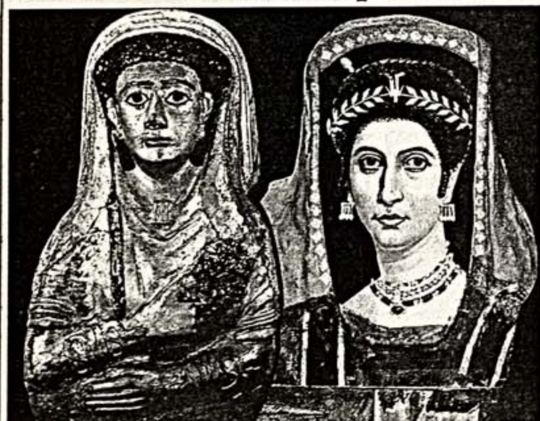
"Портреты" двух женщин: Афродиты (50 г. н.э.) и Исиорны (100 г. н.э.)