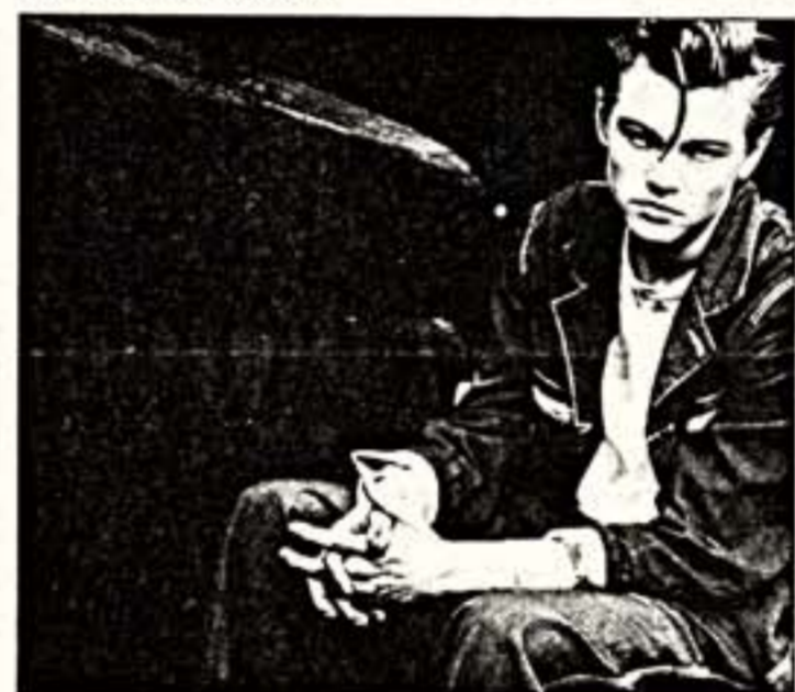
Леонардо Ди Каприо