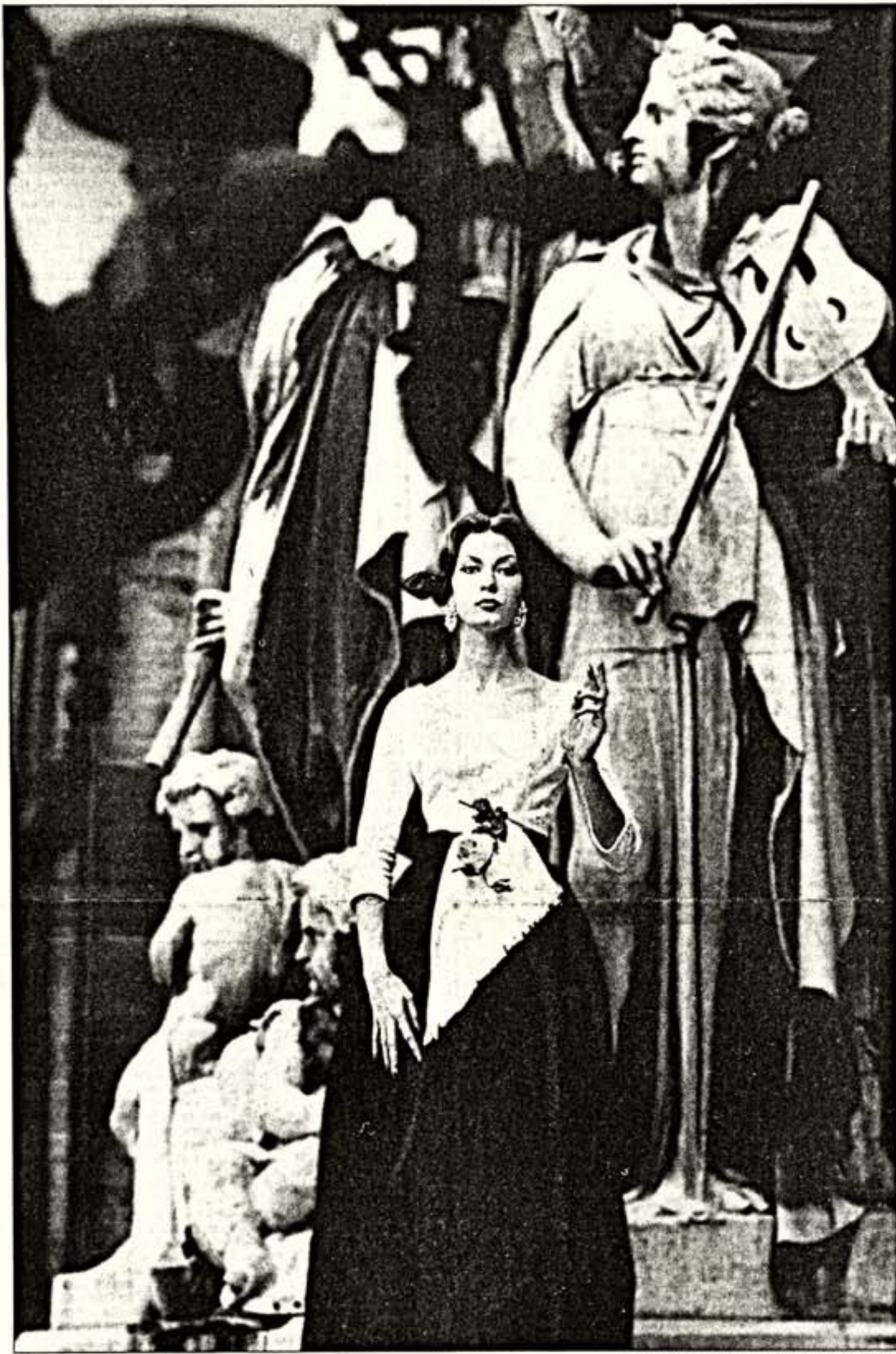
Вильгельм Клайн. "Мэри и скрипач", 1958 г.

В Москве открылся Второй международный Месяц фотографии "Фотобиеннале"-98