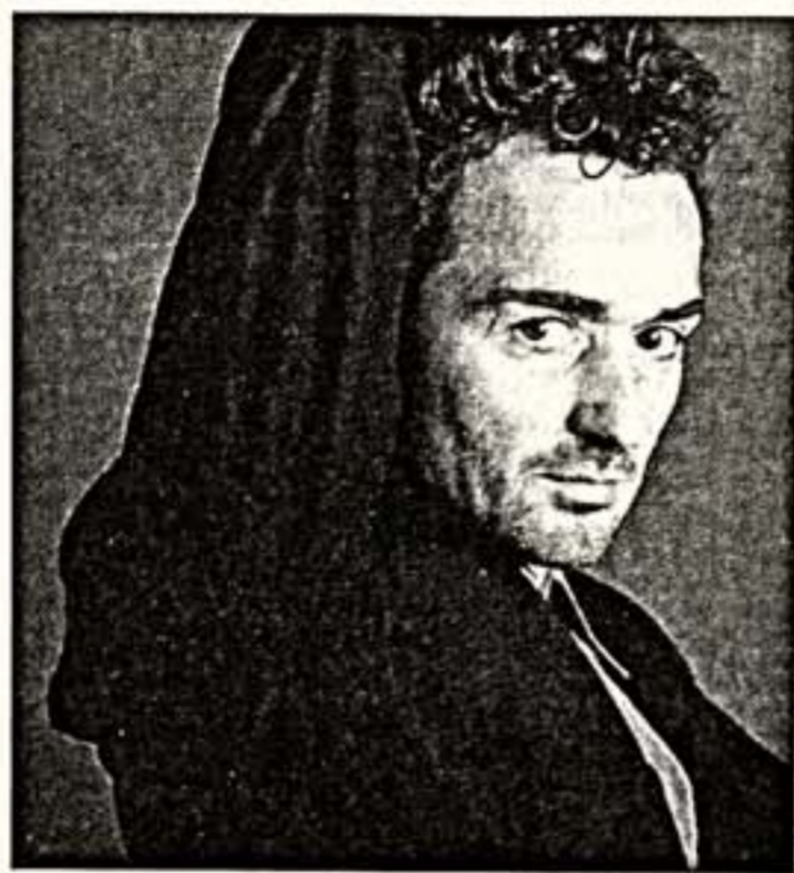
Верху: сцена из балета "Благоволение"; Внизу: Анжел Прельжокаж во время работы над "Казановой"

балета тормозит развитие современного танца. Анжелу Прельжокажу вообще присуща прямолинейность суждений. В 1995 году, когда кандидат от Национального фронта Жан-Мари Ле Пен был избран мэром Тулона, где тогда работал Прельжокаж, хореограф с женой и детьми переехал в Экс-Ан-Прованс. Заявил, что он - сын албанских эмигрантов - не считает возможным работать в городе, где правит человек крайне националистических взглядов.