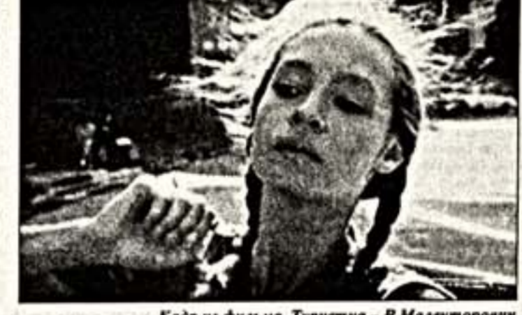
Кадр из фильма "Туристка" - В.Малекторевич

достать действительно свежую (не дожидаясь двойного скорого показа по телевидению) и неплохого качества ленту. Лицензионные видеопираты не рвутся информировать, а тем более воочию знакомить критиков с новыми образцами своей продукции - хотят посмотреть, поупайать, как все. Но ведь и так называемые "все" не такие уж богатые, чтобы сказать в немалом количестве видеокассеты. Другое дело - взять напрокат. Однако система видеопирата у нас пребывает в столь же оборотном состоянии, как и кинопрокат: никому не выгодно заниматься подобным продвижением фильмов к зрителям, в государство как будто специально все делает для того, чтобы законными и несуетными налогами душище детально редких энтузиастов-предпринимателей, желающих не продавать кассеты, а именно выдавать их напрокат. Ведь во всем мире, а особенно в Америке, как раз видеопрокат оказывается успешнее и доходнее, чем видеопродажа, и многие проработавшие пункты встречаются чуть ли не на каждом углу - почти как у нас на рубеже 80-90 годов, когда в любом продовольственном магазине предлагали напрокат зарубежные фильмы, правда, импортные. Сейчас же оказалось свернулось и бизнес в закупке видеозаписей (туда еще и дороги), и, что печальнее, прокат видеокассет, как кассовых, так и культурных. И обижается все это отнюдь не приверженностью бизнесменов и некачественных любителей кино к непрерывному соблюдению нового закона, запрещающего лицензионную деятельность в сфере выкуса. Странная оперативность по выкусу надлежащим образом