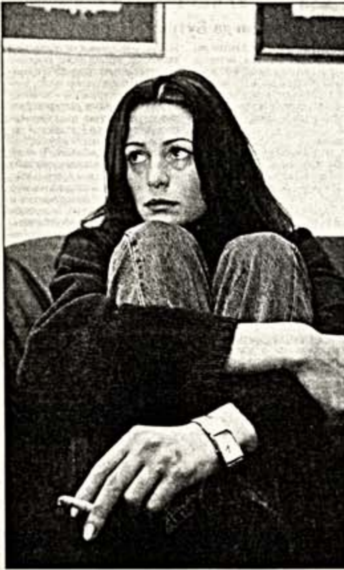
По внешним данным Оксану не раз сравнивали с Мариной Неволюей, Настасьей Кински, Джулией Робертс. Но быть похожей на кого-то и не иметь своего лица уходящая себя актриса не имеет права.