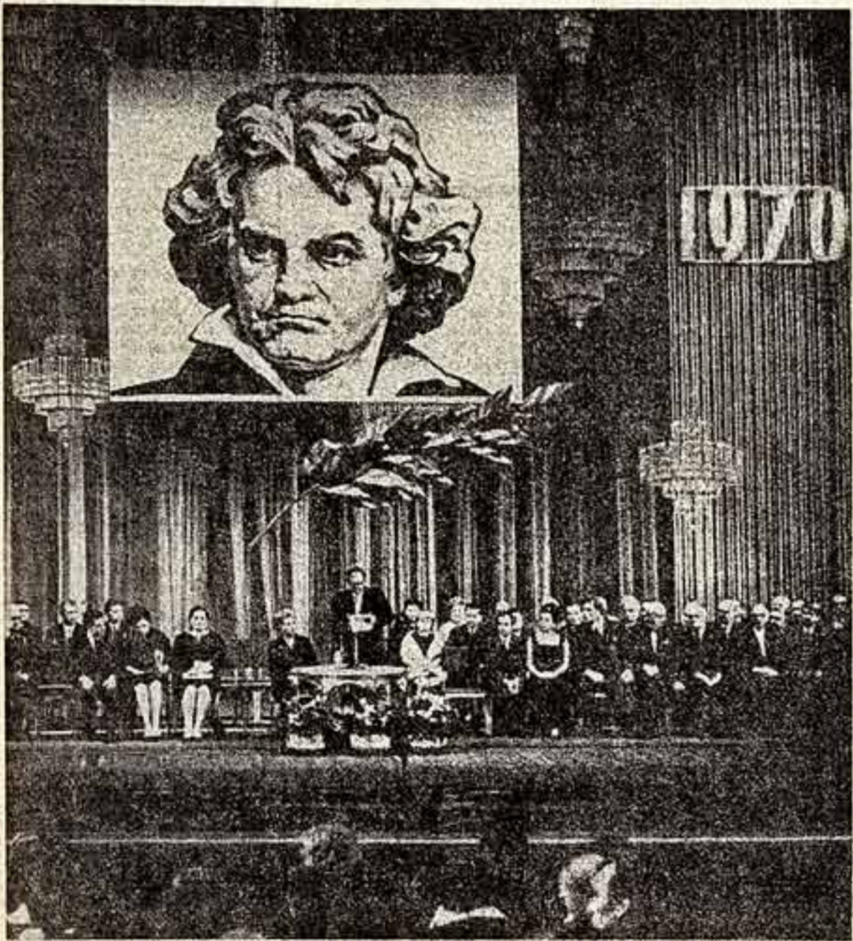
Вчера в Большом театре Союза ССР.