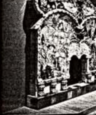
Вверху: А. Павлов. "Мать с букетом". 1926 г. Внизу: Зал М.А.Врубеля в ГТГ

Но если выставка в МГК все же сильно напоминает "Золотую карту России" в Третьяковке (густыми реплексными музеем), то открытие реконструированного зала М.А.Врубеля в ГТГ — это уже событие перестройки. Надо отдать, что 150-летие со дня рождения художника галерея практически не отмечала, отключая на собственный юбилей, зато ныне любимому интеллектуалу и массово воздвигло по заслугам. Именно