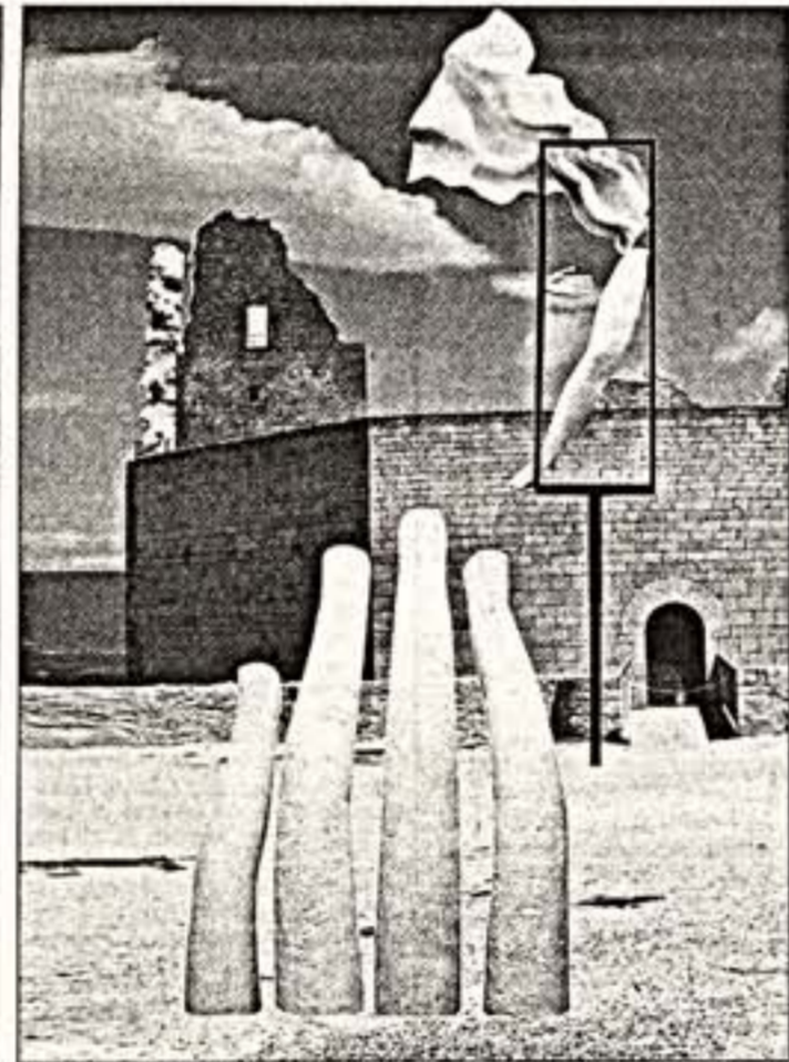
Замок маркиза де Сада в Лакосте. Фрагменты экспозиции выставки А.И. Бурганова

Над живописными холмами Лакосты, расположенной недалеко от Алены, возвышается грандиозное руины старинного французского замка. Когда-то он принадлежал маркизу де Саду. Сегодня его владельцем Пьер Карден стремится надуть в него новую жизнь. Обустраивает внутреннее пространство замка прекрасными и комфортабельными апартаментами, он решил сохранить его своеобразный внешний облик — полуразрушенные стены, хранищие воспоминания истории.