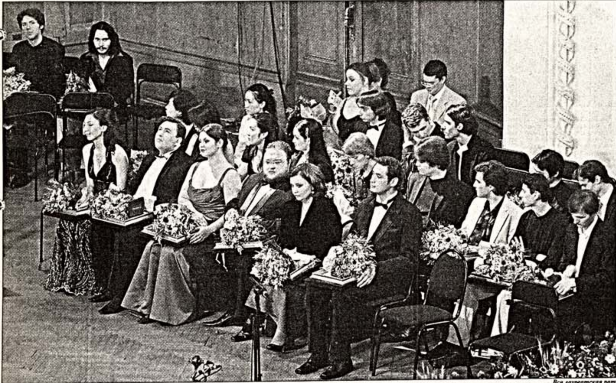
Вся лауреатская рать