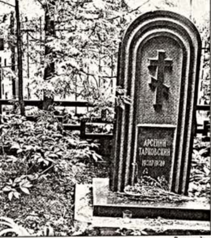
Видом рабаем и колесом, был Арсений Тарковский.

Main article text about the 100th anniversary of Arseniy Tarkovsky, discussing his life, work, and the TV program.