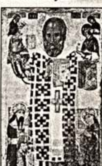
Икона с изображением святого Николая, XIV в.

В Историческом музее открыта необычная экспозиция: впервые в истории появились в музее сокровища знаменитой базилики святого Николая в Бари. Николай Угодник, заступник, защититель и скорый помощник, с давних пор вызывает на нас с инстинктивной любовью, покровитель и защитник, увы, мы ставим святому перед дальней дорогой и знакомым, и его же под Новый год ждем как Деда Мороза... Казалось бы, можно ли найти более русского святого? Между тем официально имя нашего «паломника» — Николай Мирликийский, родом он из города Мирры, что в области Ликии (Малая Азия), а главное место поклонения ему — портовый город Бари на юго-востоке Италии, где с 1087 года стоит знаменитая церковь св. Николая.