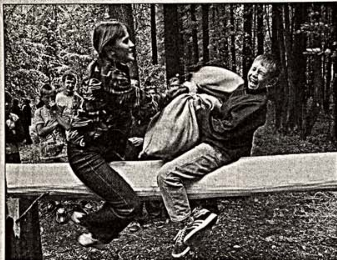
Бой на бресте