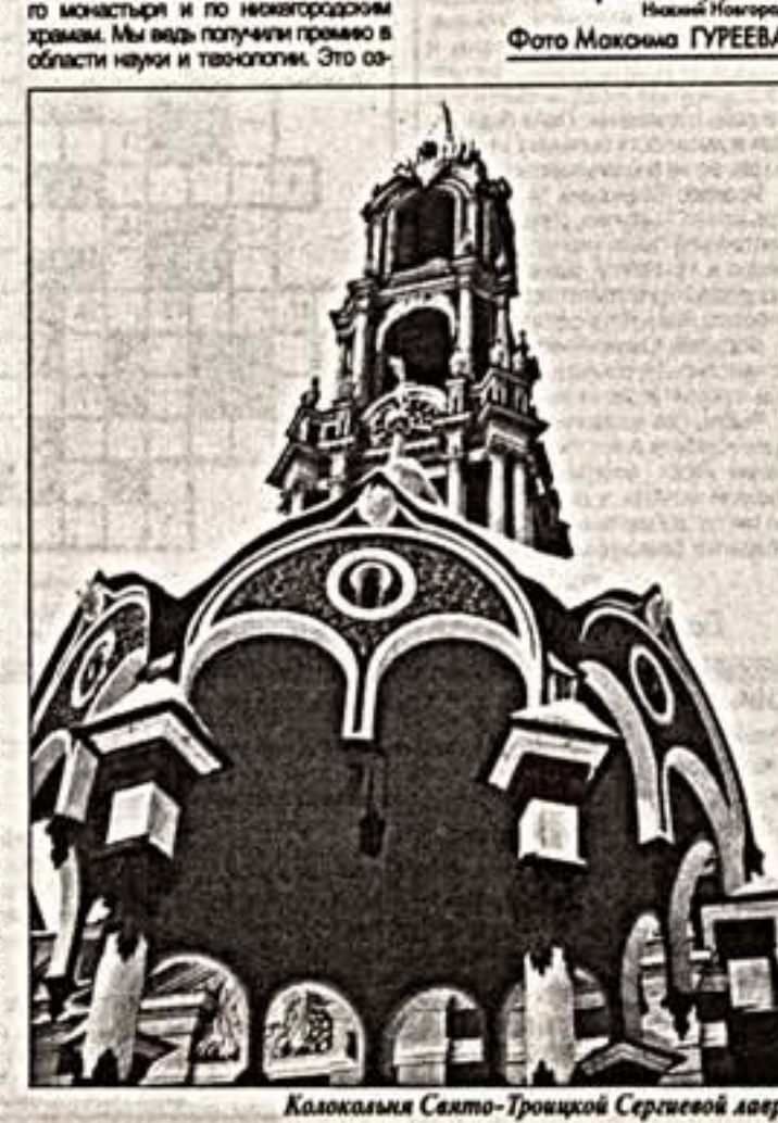
Колокольня Свято-Троицкой Сергиевой лавры