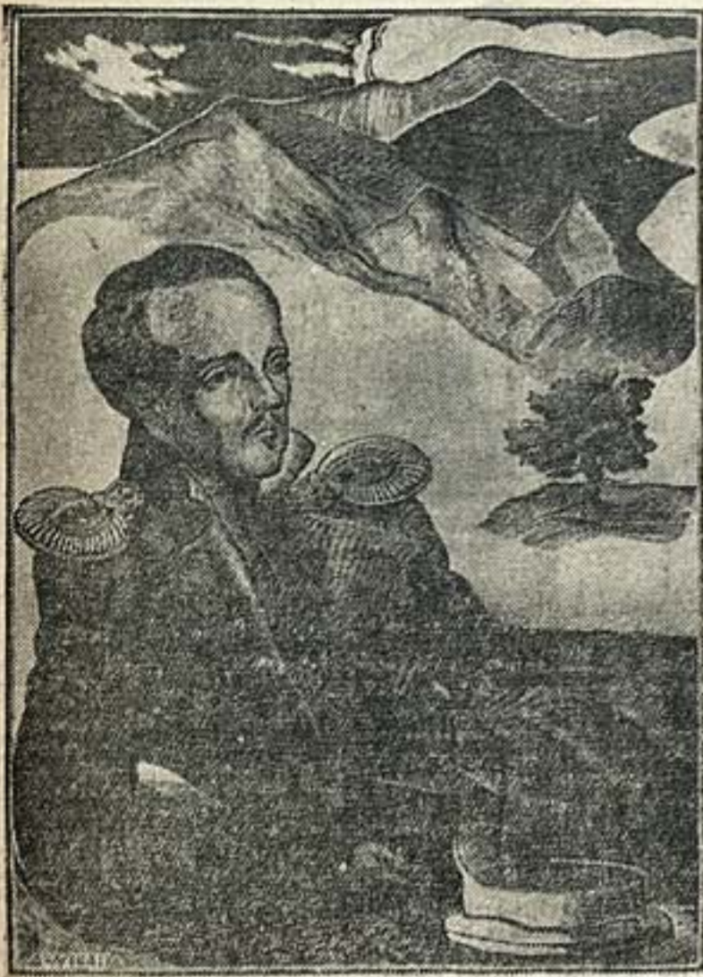
М. Ю. Лермонтов