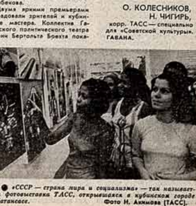
«СССР — страна мира и социализма» — так называлась фотовыставка ТАСС, открывавшаяся в кубинском городе Матанассе.