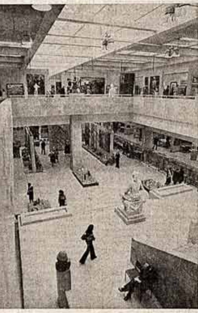
В новом Центральном выставочном зале Ленинграда, одном из крупнейших в стране, развернута юбилейная экспозиция работ художников города.