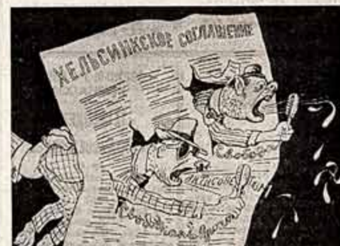
Так нас облачают баяи, которых босс толкает сзади.