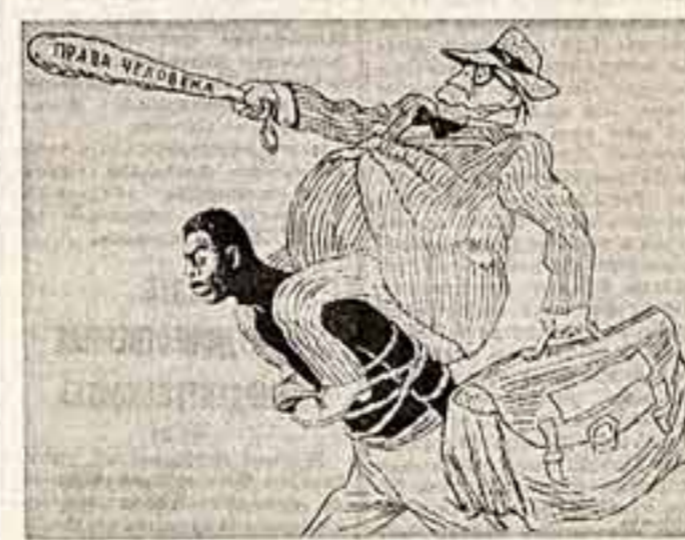
Собрался хозяин беспартийного Джека отстаивать ряко права человека.