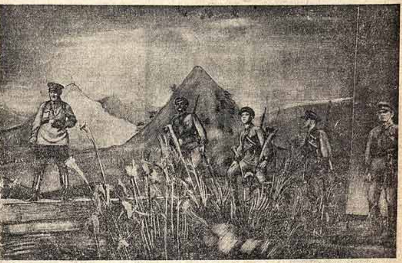
«Пад Серебряна» Н. Погодина в ЦИКА. На фото: сцена из 1 акта, Старший лейтенант Черкасов (артист П. В. Мандров) знакомит молодых пограничников с особенностями границы