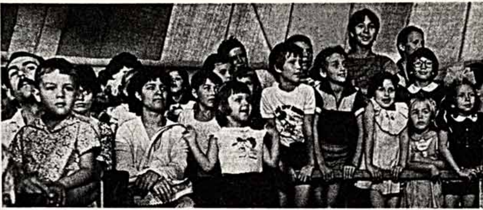
● На премьеру.

Другая, крайне болезненная для детского театра проблема — дефицит хорошей драматургии. Я убежден, что драматургия может развиваться только вместе с театром, а потому все его кризисы будут по ней не менее жестоко. И это большая радость для нас — это тоже