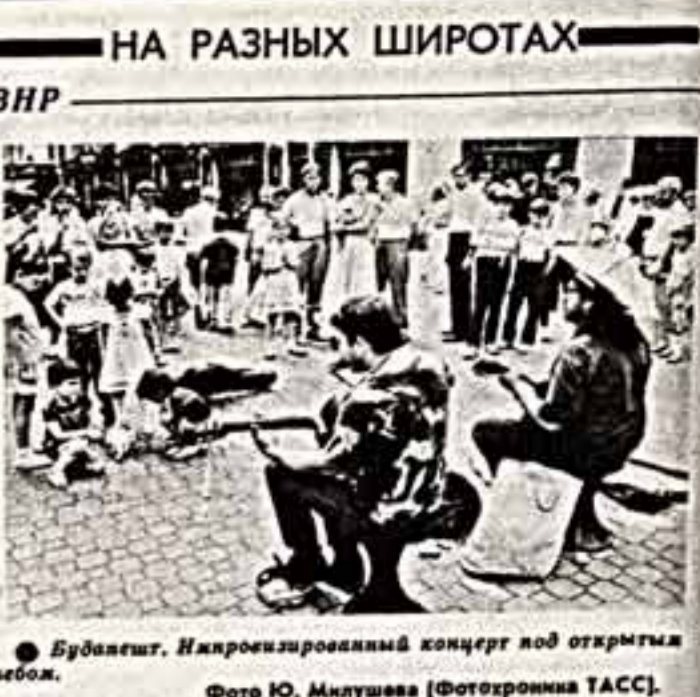
Будущий. Напряженный концерт под открытым небом.