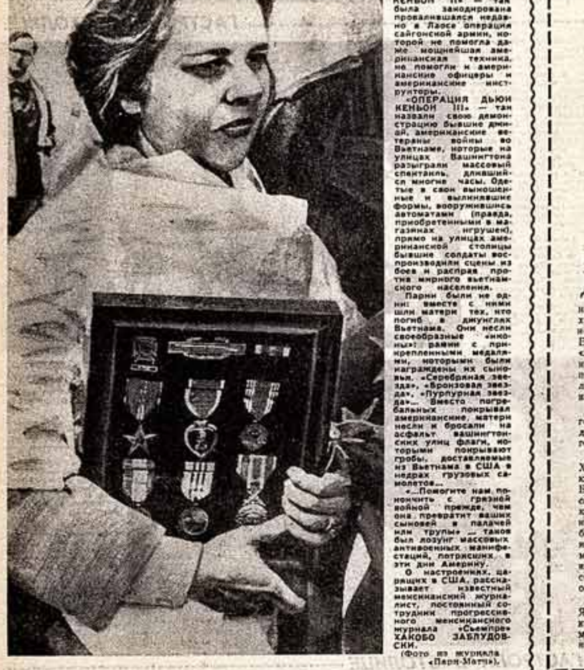
«Операция Дьюн Кенбон III» — так была зашифрована операция по освобождению острова Тира...