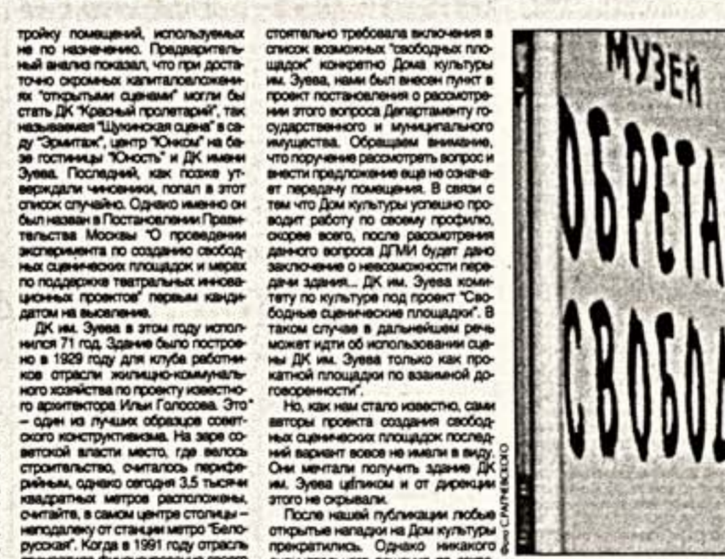
В музее на Делетской все-таки будет музей