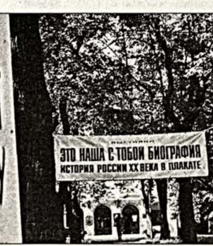
В музее на Делетской все-таки будет музей