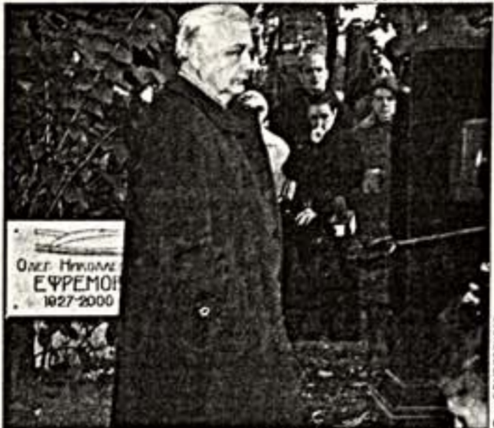
О.Табакوف. Преемник Ефремова