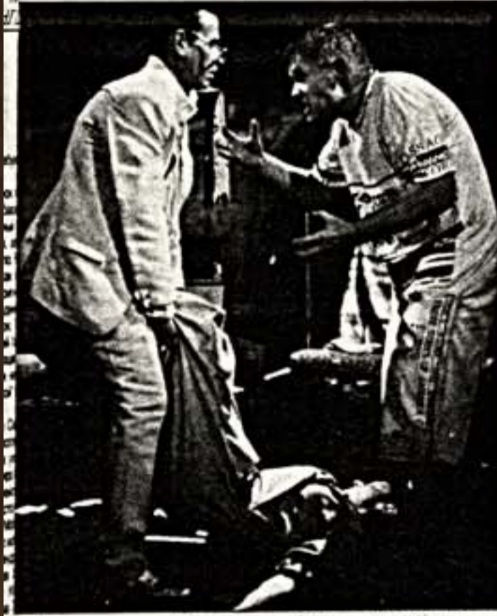
Сцена из спектакля "Петля" в постановке Р.Ибрагимбекова