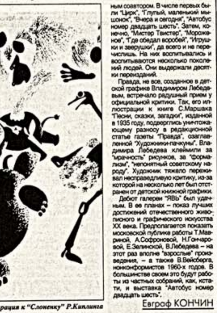
В.Лебедев. Иллюстрация к “Слоненку” Р.Киплинга