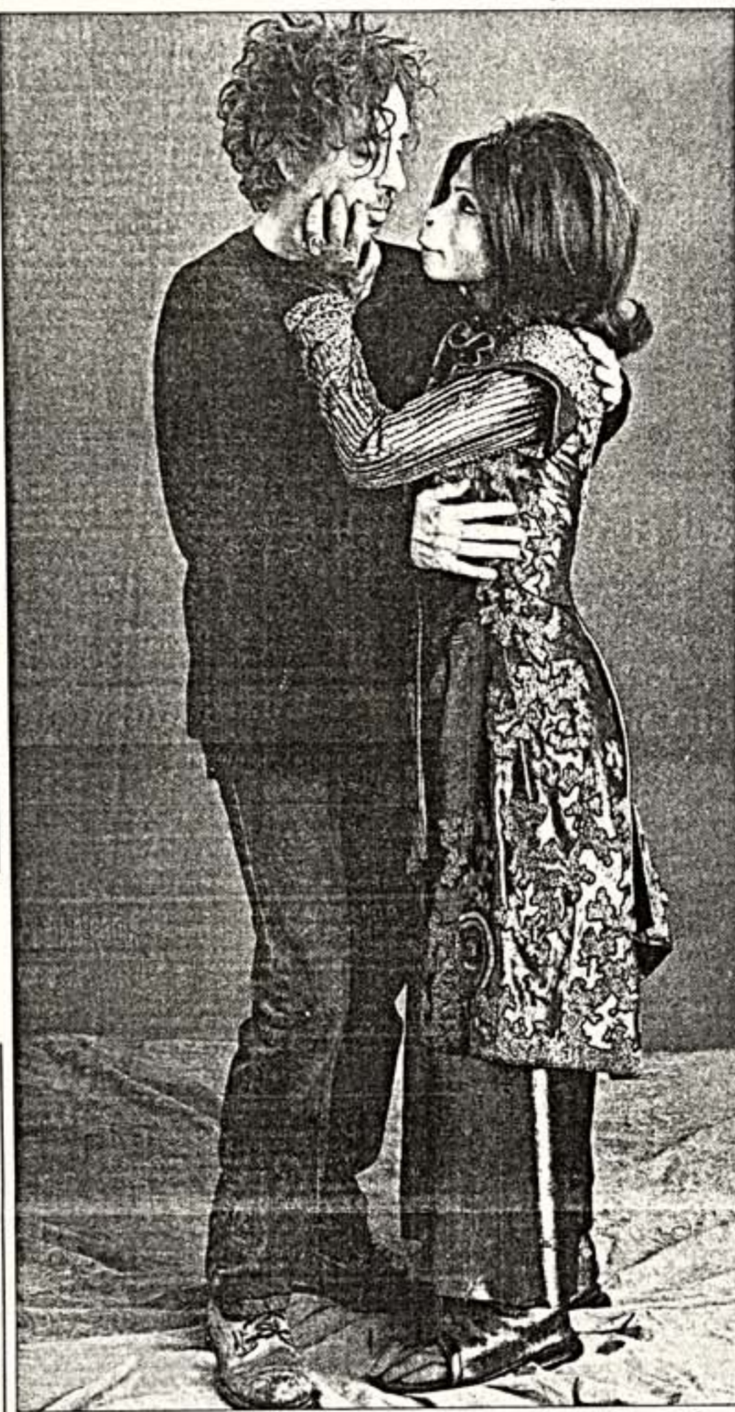
Т.Бартон и актриса Х.Бонем-Картер - исполнительница роли в фильме "Планета обезьян"