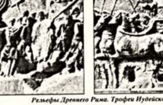
Рельефы Древнего Рима. Трофеи Иудейской войны