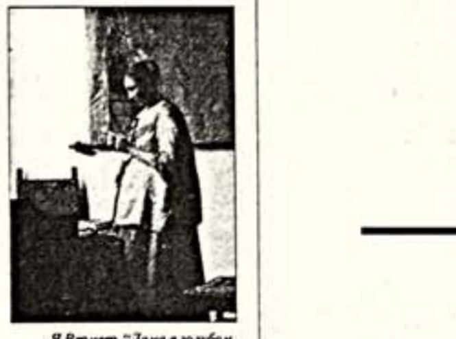
Я.Вермер. "Дама в голубом, читающая письмо"

В рамках программы "Шедевры музея мира в Эрмитаже" представлена картина Яна Вермеера "Дама в голубом, читающая письмо" (1662 — 1664) из собрания Риксмузеум, Амстердам. Простоватый шедвр Яна Вермеера относится к популярному в XVII столетии жанру "картины-ребуза", где любовное послание играет роль основной заставки, а географическая карта Голландии становится ключом к расшифровке всей сцены. Ян Вермеер создал множество картин на тему "любимого письма". В них он проводил идею гармонии и единства любящих сердец, предлагая зрителю XVII века увидеть в любви реально достижимое цельное чувство, верность, порождающую способность ждать и надеяться под семью божевами по Провидению. Общественное признание к живописному наследию Яна Вермеера пришло лишь в середине XIX века. В настоящее время известно тридцать пять работ художника. Картина "Дама в голубом, читающая письмо", побывав на семи аукционах 1712 — 1825 годов, оказалась в Англии у знатока голландского искусства Джона Смита. В 1839 году она была куплена у него Адрианом ван дер Хофом (1778 — 1854), меценатом и собирателем картин голландской живописи XVII века, и завешана им впоследствии, как и все коллекции, государству. Выставка картины Яна Вермеера "Дама в голубом, читающая письмо" организована по соглашению об обмене произведениями живописи между Риксмузеумом (Амстердам, Нидерланды) и Эрмитажем.