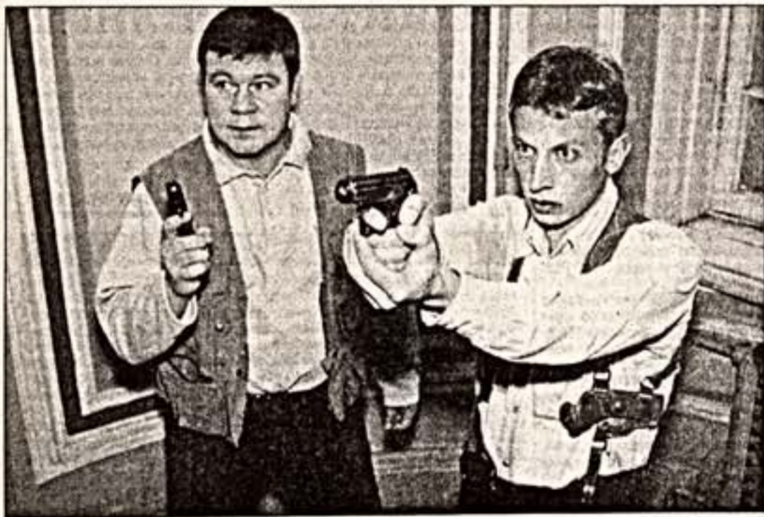
Кадр из фильма "Улицы разбитых фонарей"