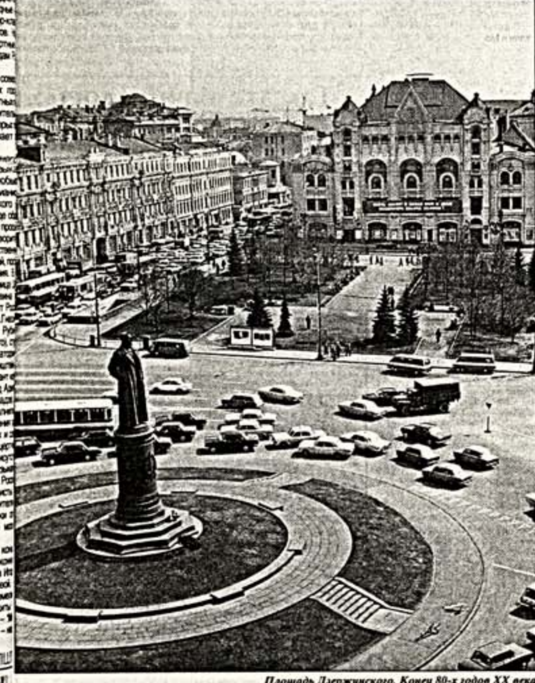
Площадь Дзержинского. Концы 80-х годов XX века