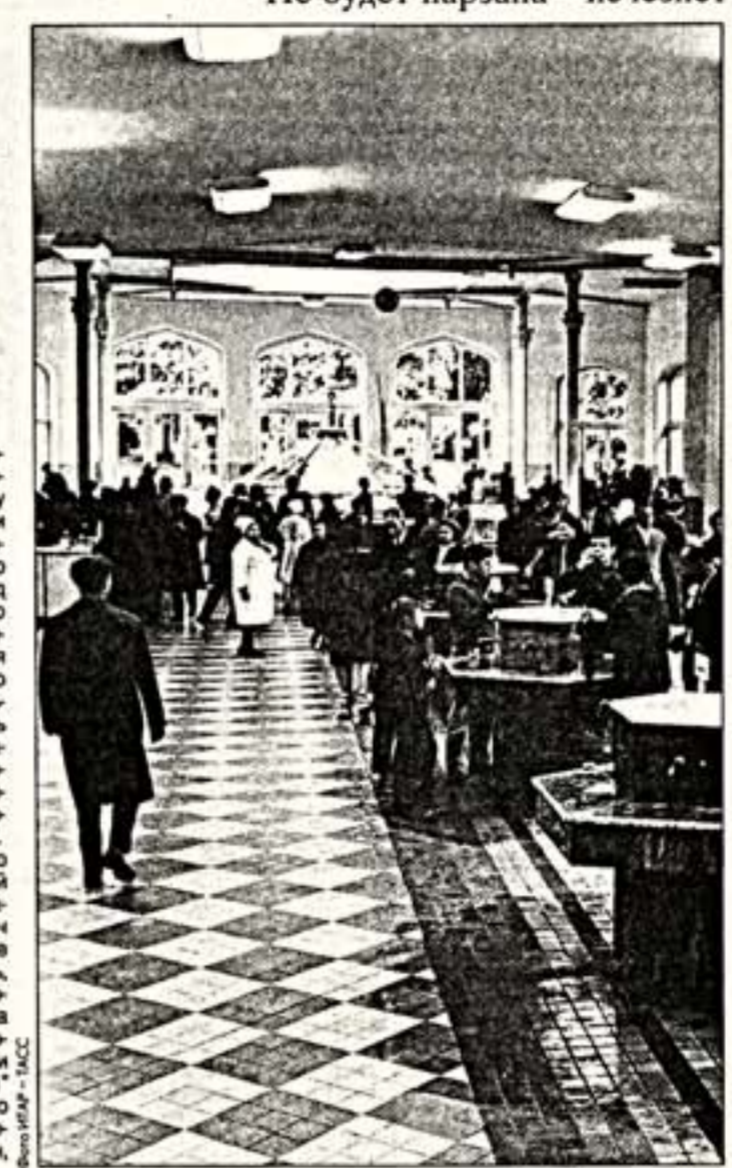
Вид из Нарзанной галереи