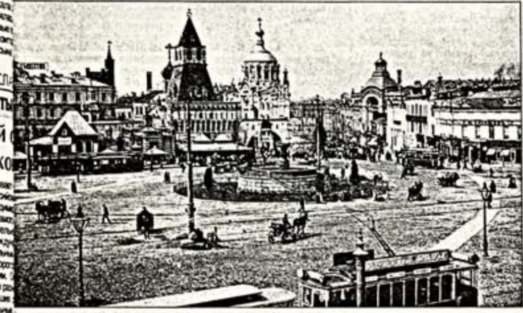
Лубянская площадь. Концы XIX века

нообразный постамент, утверждающий на круглом же основании газон, как у Мухомовой, дьявольский, руки в карманах, как у Лебедева, и некоторые другие детали. Но если музеевская композиция памятника и лебедевская статуя сделаны бы эти два произведения стилистически и композиционно, то памятник Вучетича достаточно оригинален по своей идее и ее воплощению. Вучетич не мог видеть живого Дзержинского. Он работал по фотографиям. Он поставил памятник в центре площади на месте фонтана Виталии сичи к зданию КГБ на Лубянской площади. В центре площади на месте фонтана Виталии сичи к зданию КГБ на Лубянской площади. В центре площади на месте фонтана Виталии сичи к зданию КГБ на Лубянской площади.