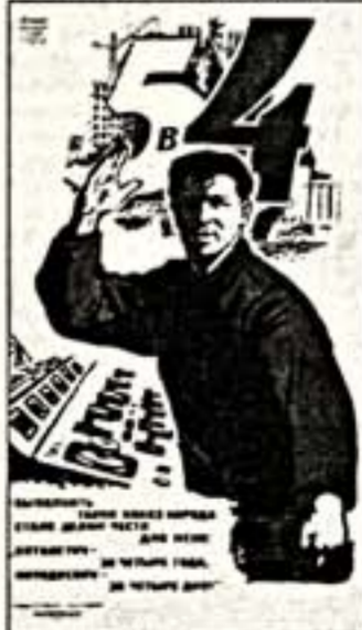
В. Сурьяшинов. Плакат "5 в 4", 1971 г.

Плакат 1920 - 1980-х годов - в Государственном Историческом музее