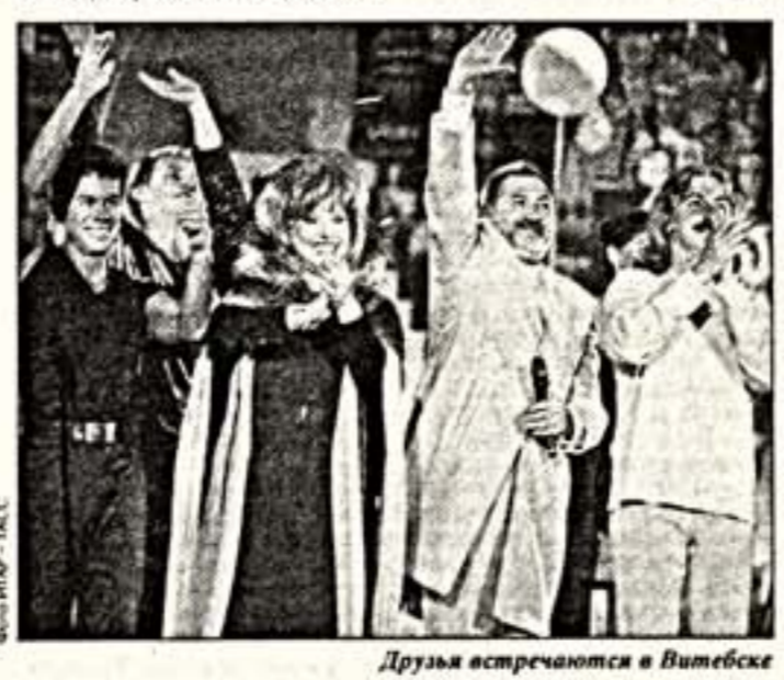
Друзья встречаются в Витебске