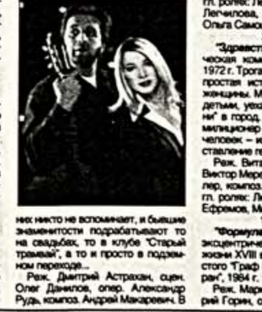
некоторые не вспоминают, и бывшие знаменитости подрабатывают то на свадьбах, то в клубе "Старый трамвай", а то и просто в подземном переходе...