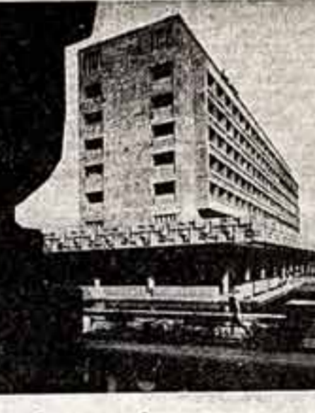
Славно потрудились архитекторы республики, преобразив облик своей столицы.