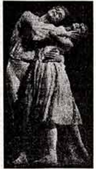
МАНОН НА ПУАНТАХ

Середина апреля выдалась в этом году не из лучших. Дожди и мокрый снег почти по всей Югославии. Разноцветными зонтиками пестрят улицы Белграда, но дождь снижает жизненный ритм разве лишь внакальку.