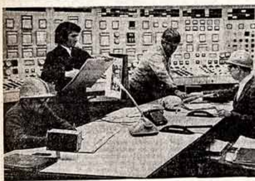
Художник А. Алакалхидзе у героев своей будущей картины — работников Маркиской ГЭС.

народов мира широко представлено земляками коллектива Чардынского областного филармонического ансамбля. Хасан и Хусейн — братья-близнецы, поселившиеся в танце. Они с успехом гастролировали в Германской ФРГ, Польше и Чехословакии. Но наряду со своим новым программой они покажут прежде всего в клубы, домах и дворцах культуры республики.