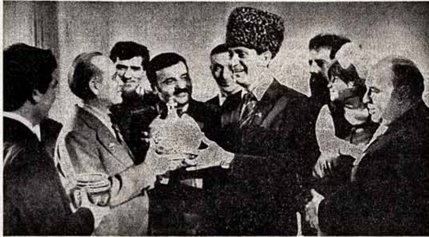
«Чародей танца» — так называют народного артиста СССР Махмуда Эсамбаева. С большим успехом прошли его гастроли в Целинограде. После концерта во Дворце чемпионов артист встретился с труженниками области.

Мы знаем, какой массовый и глубокий отклик нашли эти слова в нашей партии, у всех советских людей. Об этом говорят и первые сообщения о работе в новом году, и напряженные встречи планы и обязательства, которые принимаются трудовыми коллективами, и возросшая эффективность и массовость социалистического соревнования. Творческий подъем, нацеленность на большие дела, обострившаяся чувство ответственности, истеричности к недостаткам, ко всякого рода показухе и парадности — эти приметы хорошо ощущаются сегодня во всей атмосфере нашей общественной жизни. И в этом — первая гарантия того, что третий, сердцевинный год пятилетки будет ознаменован новыми свершениями на всех участках коммунистического строительства.