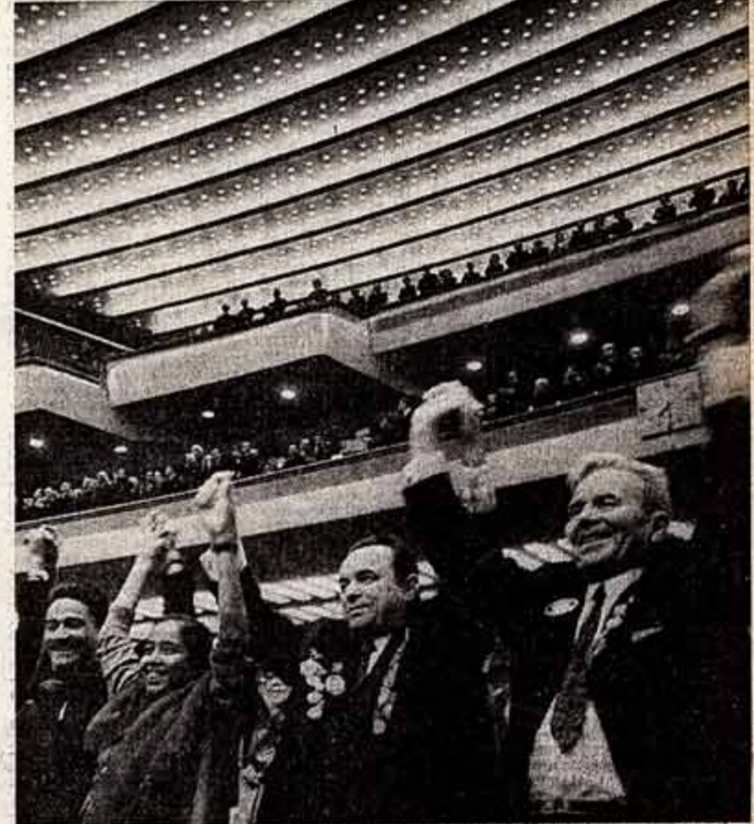
● Закрытие Всемирного конгресса миролюбивых сил.

На заседании комиссии «Сотрудничество в области защиты окружающей среды» отмечалось, что охрана окружающей среды имеет не только научно-технический, но и социальный аспект. Широкий круг вопросов — о роли деятелей искусства, культуры и просвещения в пропаганде идей мирного сосуществования и разрядки